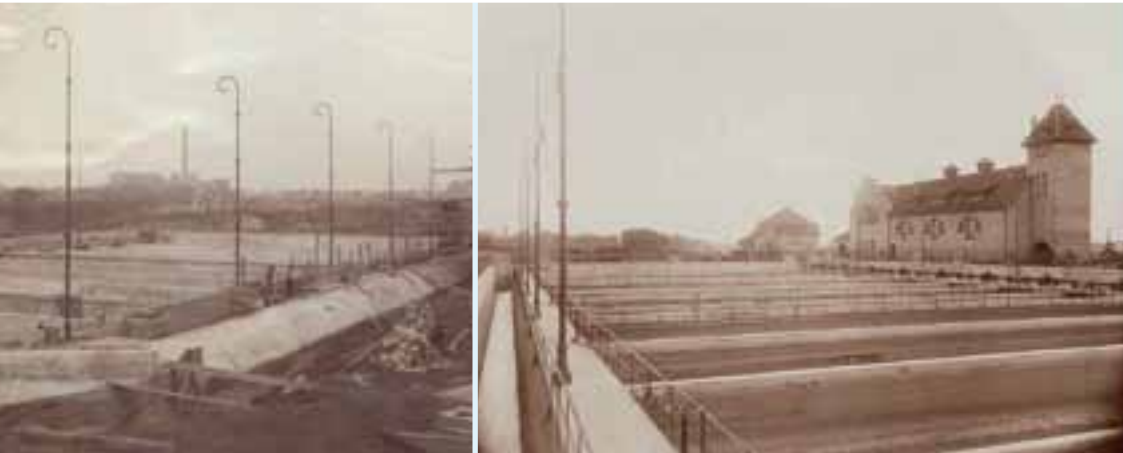
NEUBAU DES KLÄRWERKS UM 1905