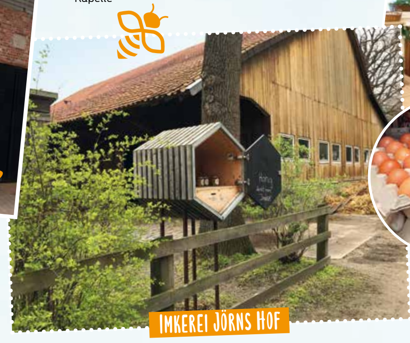
IMKEREI JÖRNS HOF

Selbstbedienung: ganzjährig, 24 Stunden | Adresse: Dunkler Weg 9, 30901 Wedemark-Abbensen | Rad: Radtour 5, Wedemark | Bus: 460, 694, 696, 697 Hst. Abbensen Kapelle