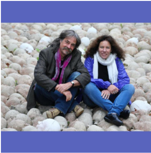
Bildunterschrift Urheber: Wolfram Hänel