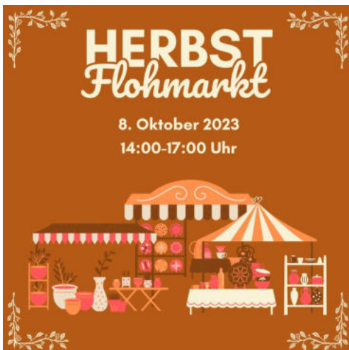
Bildunterschrift Urheber: Kulturbüro Misburg-Anderten

Veranstalter*in: Eine Kooperation zwischen Kulturbüro Misburg-Anderten und SoVD Misburg