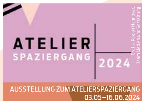
AUSSTELLUNG ZUM ATELIERSPAZIERGANG 03.05.–16.06.2024

www.atelierspaziergang-region-hannover.de und über nebenstehenden QR-Code