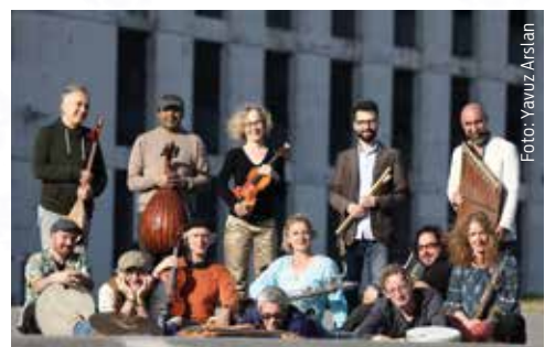
TRANSORIENT ORCHESTRA | 14.06.2024