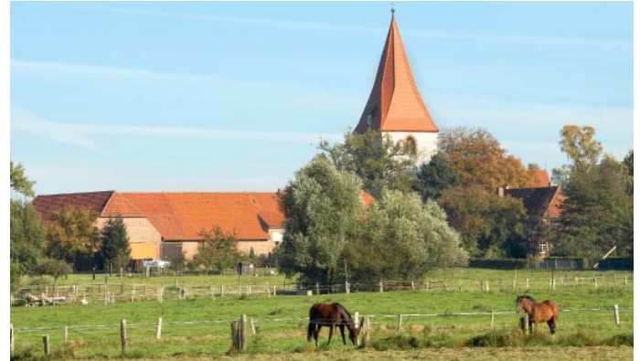
Ländliche Idylle in Isernhagen KB

Die Tour ist rund 16,6 Kilometer lang und führt durch idyllische Feld-, Wald- und Moorlandschaften. Es geht los vom Hof Döpke in Isernhagen, (Ziegeleiweg 1, in der Ortschaft Neuwarmbüchen). Der Reiter muss einige Male eine Straße überqueren, dies ist aber in der Regel kein Problem, da diese wenig befahren ist. Vom Hof Döpke geht es zunächst in Richtung Oldhorster Moor. Nach rund zwei Kilometern taucht linksseitig der Ort Oldhorst auf. Links davon wechselt man hinter das Dorf und reitet nordöstlich auf Engensen zu. Wenn der alte Postweg, der von Hannover nach Celle führt, erreicht ist, geht es immer geradeaus, vorbei an einer großen Sandkuhle. Die Gaststätte „Haus am Walde“ liegt am Ende der Siedlung auf dem Lahberg direkt am Wald.