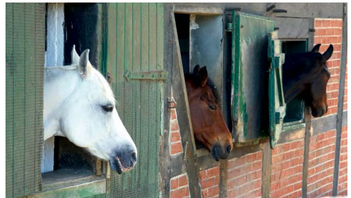
Pferdeleben auf dem Hof