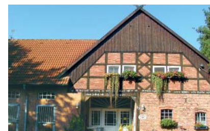
Pferde und Reiter sind willkommen

Im Ortsteil Dedenhausen hat die Familie Depenau ein Gästehaus mit fünf Doppel- und einem Einzelzimmer neu errichtet. Urlaub auf dem Lande ist dort mit dem eigenen Pferd möglich. Für die Reitpferde gibt es helle, luftige Boxen, eine große Reithalle (20 x 40 m), Longierplatz und Führanlage, dränagierter Auslauf sowie Waschbox und Solarium. Der Hof Depenau wurde von der reiterlichen Vereinigung für den Bereich „Pensionspferdebetrieb-Pferdehaltung-Zuchtbetrieb“ mit vier Sternen ausgezeichnet.