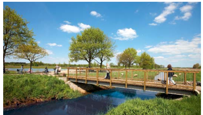
Wietzpark zwischen Isernhagen und Langenhagen