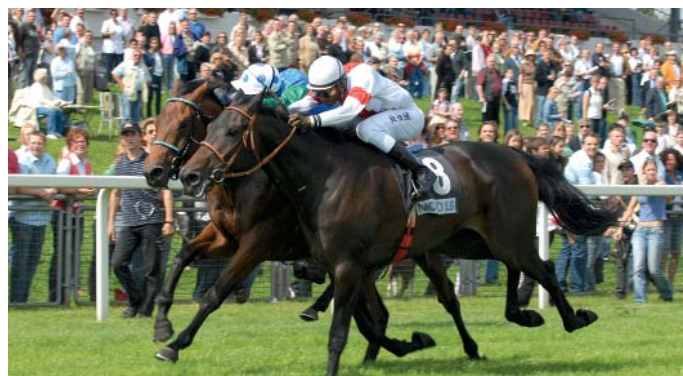
Spannende Kopf-an-Kopf-Rennen auf der Neuen Bult

In Hannover setzt man neben talentierten Pferden auch auf starke Sponsoren, die einen großen Anteil an der Mitgestaltung der sportlichen Veranstaltungen haben.