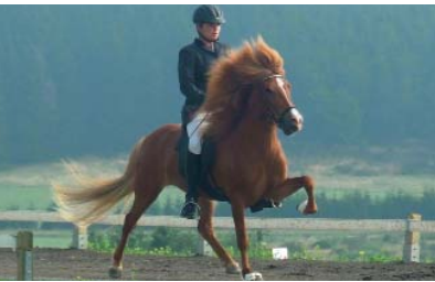
Im Tölt durch die Natur

Die gut erhaltenen Fachwerkhäuser der vier Bauerschaften unterstreichen den ländlichen Charakter der Gemeinde. Ob bei einem Spaziergang um den Altwarmbüchener See