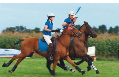
Teamsport zur Pferd

Niedersachsen. Die 60.000 m 2 große Fläche des Poloplatzes grenzt an den Golfpark Langenhagen-Hainhaus. Viele Polospieler bezeichnen die von hundert Jahre alten Bäumen umgebene Spielfläche als schönsten und schnellsten Poloplatz in Deutschland. Der Club organisiert rund ums Jahr interessante Turniere, an denen regelmäßig auch herausragende Mannschaften aus Südamerika teilnehmen. Die Einnahmen der Turniere und Veranstaltungen des Polo-Clubs dienen oft wohltätigen Zwecken.