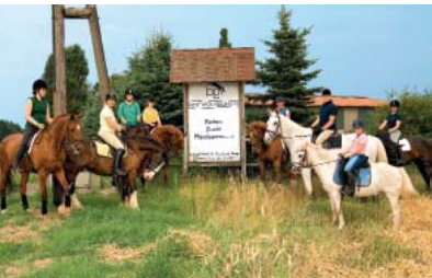
Herzlich willkommen auf Hof Wolfskuhlen

schönen Fachwerkgebäuden ist rund ums Jahr Kulisse für zahlreiche Veranstaltungen. Jeden dritten Samstag in den Monaten April bis September kommen Zehntausende Tierliebhaber zum Pferde- und Hobbytiermarkt. Der 2,5 Kilometer lange Spargelrundweg und die Burgdorfer Spargelwochen sind Anziehungspunkt für Genussmenschen aus Nah und Fern.