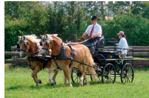
Geschichte erlebbar machen