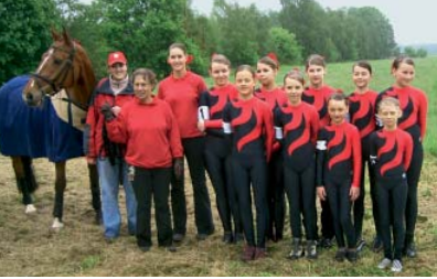
Voltigieren fördert die Balance

Zwischen großen Moor- und Waldflächen, ausgedehnten Feldmarken und kleinen Seen findet hier jeder Naturfreund sein ganz persönliches Freizeitidyll.