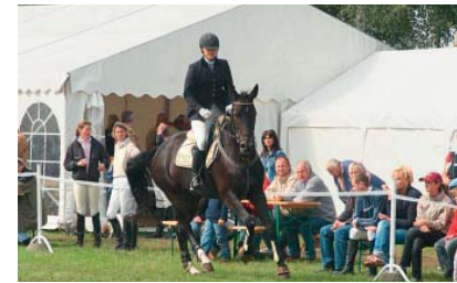
Reitturnier – Schnelligkeit und Konzentration

Der Verein wurde im Dezember 1974 gegründet und verfügt über eine Reithalle (20 x 47 m), Dressur-, Spring- und Fahrplätze. Neben der Spring- und Dressurausbildung gibt es im Reit- und Fahrverein Brelinger Berg ein reges Vereinsleben – es werden regelmäßig Ausflüge organisiert und es finden spannende Turniere statt. Als Kommunikationsmittelpunkt des Vereins befindet sich in der Reithalle das „Reiterstübchen“ mit Bewirtung. Einen ganz besonderen Höhepunkt bietet der Verein jedes Jahr im Oktober: Die Hubertusjagd hinter der Niedersachsenmeute, die weit über die Grenzen Hannovers hinaus bekannt ist und jedes Jahr viele Besucher in die Wedemark lockt.