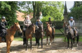
Auf die Sättel, fertig, los!

Rund 20 km vor den Toren der Landeshauptstadt liegt Burgwedel – hier lässt es sich natur- und stadtnah wohnen und leben. Der beliebte Springhorstsee und der neu gestaltete Amtspark bieten Sportlern und