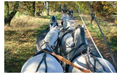
Im Vierspänner unterwegs

Der Reit- und Fahrverein Neuwarmbüchen e.V. auf dem Hof von Familie Döpke bietet jedem Reiter viele unterschiedliche Möglichkeiten zum aktiven Pferdesport – vom Anfänger bis zum Turniersportler. Es stehen mehrere Dressurplätze (20 x 40 m und 20 x 60 m), zwei Springplätze und eine Reithalle (20 x 40 m) zur Verfügung. Die Anlage bietet außerdem über 40 Boxen, großzügige Sommerweiden und Ausläufe für private Einsteller. Ein Dressur- und Rasenfahrplatz sowie Trainingsfahrten im freien Gelände lassen für Kutschfahrer keine Wünsche offen. Jedes Jahr stehen unterschiedliche Lehrgänge und Turniere auf dem Programm. Eine aktive Jugendarbeit steht ebenfalls im Vordergrund. Der Verein ist außerdem stark in die Dorfgemeinschaftsaktivitäten eingebunden, wie z. B. Ponyreiten, Festumzüge, Planwagenfahrten, eine Dressurquadrille und Volti-Schaubilder zu verschiedensten Anlässen.