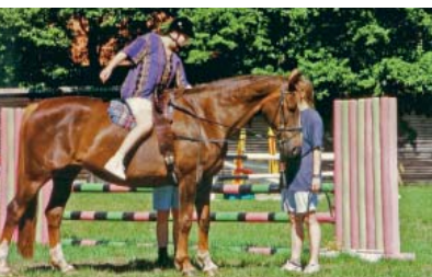
Reiten als Therapiemaßnahme