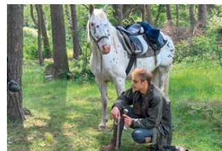
Wie im Wilden Westen

Der Verein wurde im Jahr 2001 von sieben begeisterten Fans des Westernreitens gegründet und umfasst mittlerweile rund 130 Mitglieder. Insgesamt 13 Schulpferde, vom Shetty bis zum Hannoveraner, finden auf dem beleuchteten Außenreitplatz (20 x 40 m) oder dem Geländespringplatz ausgiebige Bewegungsfreiheit. Direkt vom Hof zu erreichen ist ein schönes Ausreitgelände mit langen Wald- und Sandwegen. Die Vereinsschwerpunkte liegen in der Horsemanship, Jugendarbeit sowie im Gelände- und Wanderreiten. Zusätzlich werden eine Anfängervoltigiergruppe und zwei Reitgewöhnungsgruppen angeboten. Kinder und auch reitunerfahrene Erwachsene können langsam und ruhig an das Pferd herangeführt werden, denn eine vertrauensvolle Beziehung zwischen Mensch und Tier bildet die Grundlage für den Spaß am Reiten. Menschen mit Handicap können hier ebenso im Rahmen ihrer individuellen Möglichkeiten die Freude am Reitsport genießen. Für die Sicherheit und alles Wissenswerte rund ums Pferd sorgen beim Westernreitverein ein Trainer C sowie fünf lizenzierte Trainerassistenten Reitsport und drei Berittführer. Besonders interessant für ehrgeizige Reiter: Regelmäßig um Himmelfahrt können auf dem Hof Abzeichenprüfungen für Steckenpferd, Hufeisen-Basispass und Reitpass – auch von Nichtmitgliedern – absolviert werden.