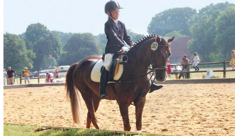
Früh übt sich wer erfolgreich werden will!

Gemütliche Landgasthöfe sowie traditionelle Märkte und Veranstaltungen laden zum Verweilen ein. Während das Heimatmuseum Richard Brandt seinen Besuchern eine Reise in die Vergangenheit ermöglicht, gewährt die größte Wirtschaftsschau der Region einen Blick in die Zukunft von Handwerk, Dienstleistung, Handel und Industrie.