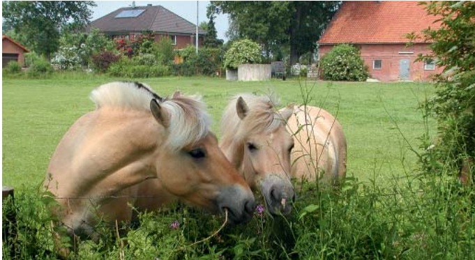
Ein Paradies für Vierbeiner