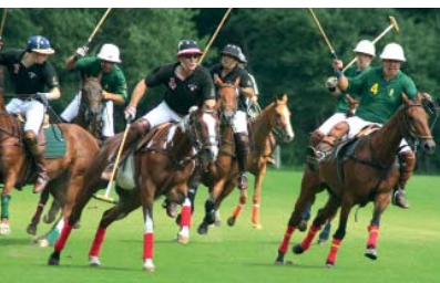
Tempo, Taktik, Tore

Diese Stadt ist ein Wirtschaftszentrum mit ländlichem Charme – auf rund 72 km 2 werden beide Bereiche erfolgreich miteinander vereint. Der internationale „hannover airport“