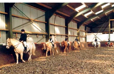
Reiten will gelernt sein