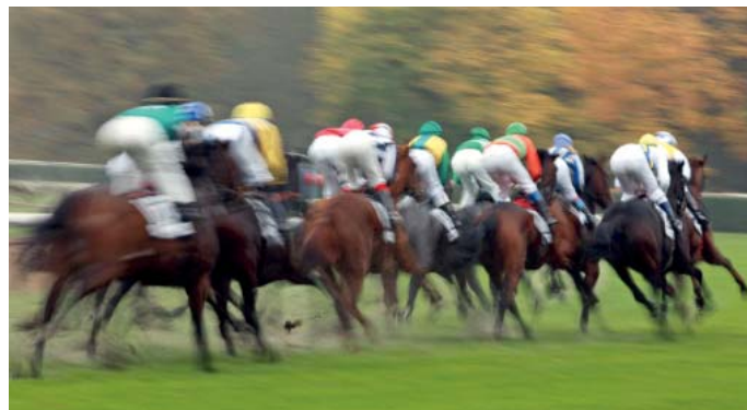
Mit 60 km/h stürmen die Galopper auf die Ziellinie zu