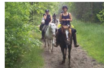
Unterwegs durch Feld und Wald