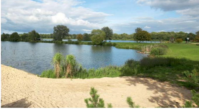
Natur pur am Irenensee