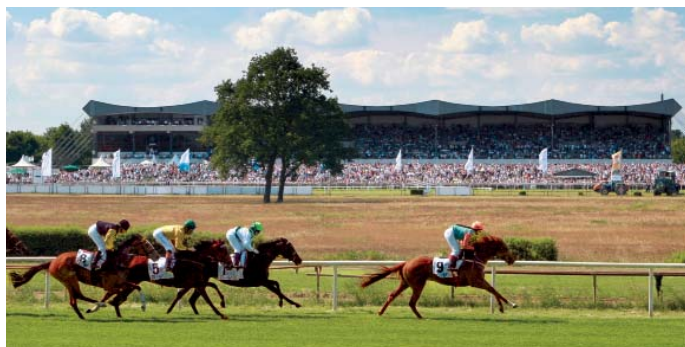
Pferderennen auf der Neuen Bult

Sonntag, 25. April 2010 Pfingstmontag, 24. Mai 2010 Samstag 26. Juni 2010 Sonntag 8. August 2010 Sonntag 12. September 2010 Sonntag 3. Oktober 2010 Sonntag 31. Oktober 2010