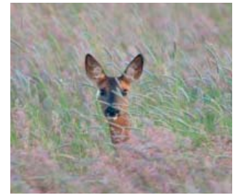
Schaulustige am Wegesrand

unberührter Natur und erinnert an Bilder einer längst vergangenen Zeit. Im Linksknick des „Alten Damms“ reitet man rechts und dann gleich wieder links in die „Thönsen Tütmoor Wiesen“, auf denen von Frühling bis Herbst Kühe und Pferde grasen. Dieser Feldweg lädt zu einem letzten Galopp ein, bevor man auf einen befestigten Weg trifft, die Wulbeck erneut überquert und geradeaus durch den Hastbruch weiter gen Norden reitet.