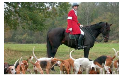
Reiten hinter der Foxhound-Meute

Faszination Jagdreiten. Die Niedersachsen-Meute e.V. pflegt seit über 50 Jahren die Tradition des Jagdreitens. Zwischen Ende August und Anfang Dezember nimmt die Meute an rund 60 Jagden und jagdlichen Veranstaltungen in ganz Norddeutschland und den benachbarten Bundesländern teil.