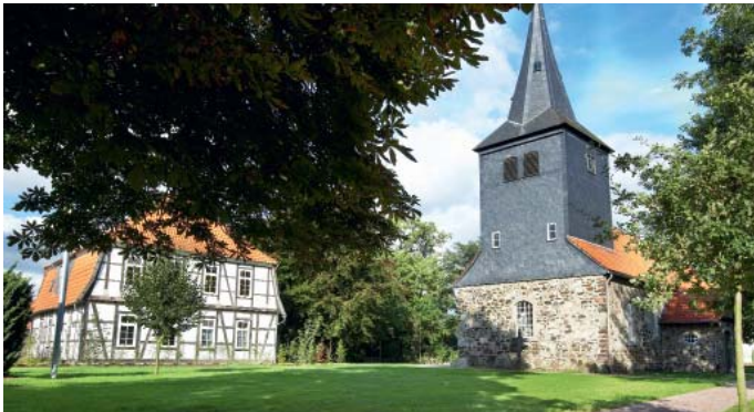
St. Petri Kirche in Hänigsen