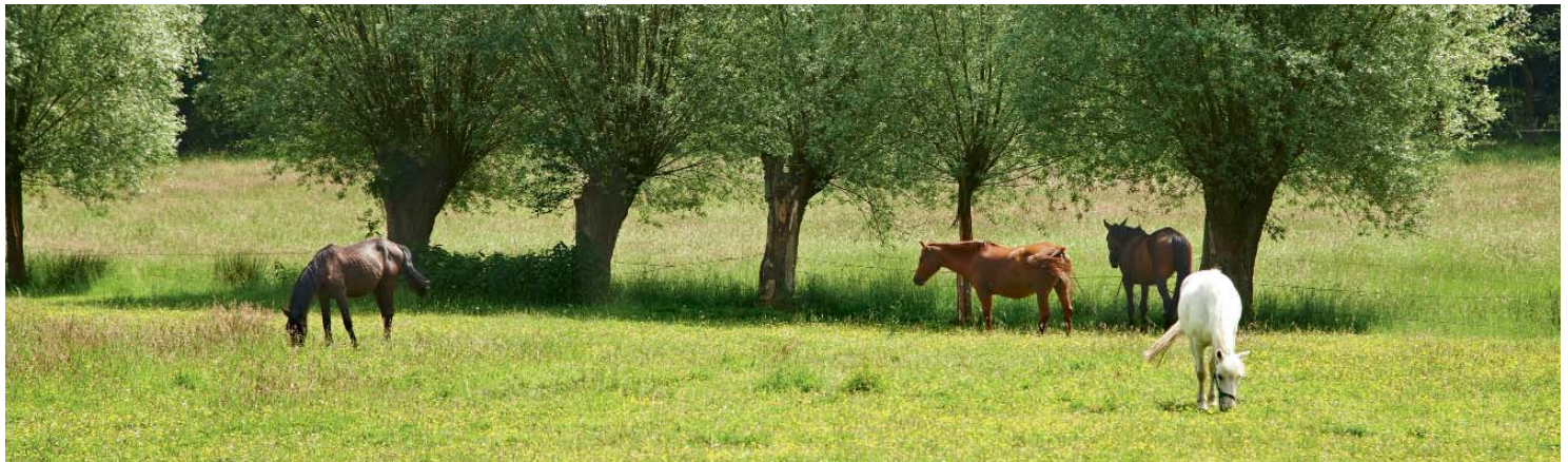
Die Pferderegion Hannover ist ein Paradies für Pferde und Reiter

Entdecken Sie Hannover mit der App für iPhone oder unter mobil.hannover.de