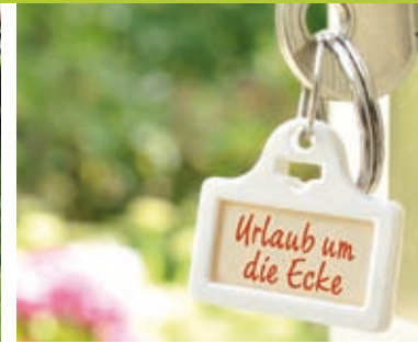
Schlüssel zum Glück