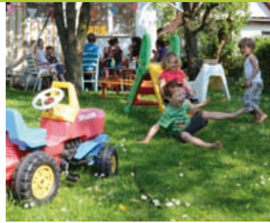
Der Garten als Spielplatz