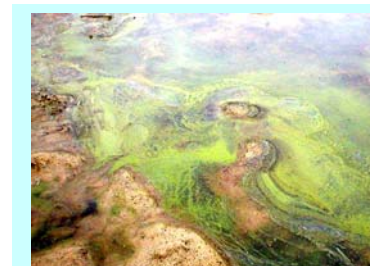
konzentrierte Aufrahmung von Blualgen

Da die behördliche Überwachung üblicherweise 4-wöchig erfolgt, kann es ohne weiteres geschehen, dass das Algenwachstum auftritt, ohne dass die Behörden hiervon Kenntnis erhalten. Somit ist jeder Badegast gehalten, individuell die aktuelle Situation zu beurteilen und eigenverantwortlich zu entscheiden, ob das Wasser zum Baden geeignet ist: