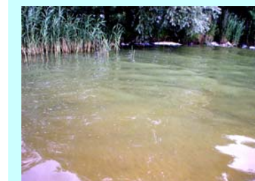
Bei anlandigen Wind entsteht eine flächenmäßige Aufrahmung von Blualgen in einer Bucht.