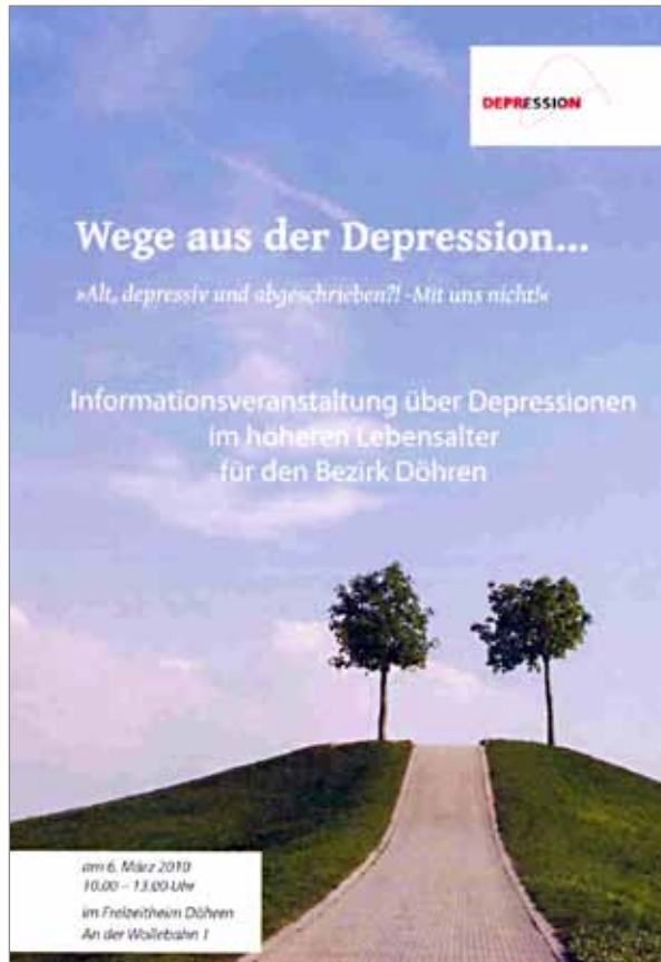
Werbeplakat zur Veranstaltung