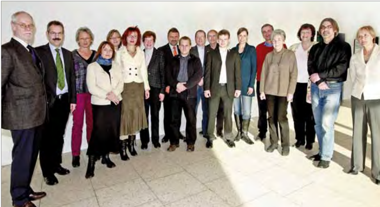
Kerngruppe des BgD 2008