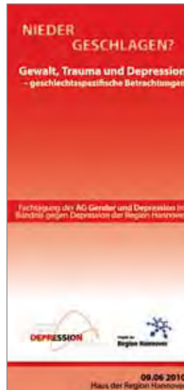
Einladung zur Tagung