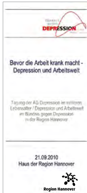
Einladung zur Tagung