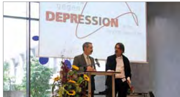
Eröffnungsveranstaltung am 1.10.2008 im Haus der Region