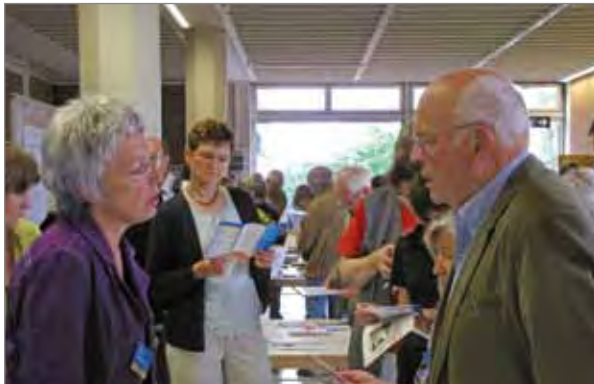
Patientenuniversität in der MHH

Bei zahlreichen Großveranstaltungen war das Bündnis gegen Depression durch einen Bündnisstand mit AnsprechpartnerInnen und Informationsmaterial vertreten. Darüber hinaus wurden Gelegenheiten in Funk, Fernsehen und Presse zur Aufklärung über die Thematik der Depression wahrgenommen.