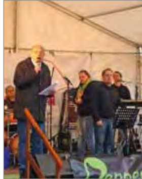
Lauf gegen Depression Oktober 2009