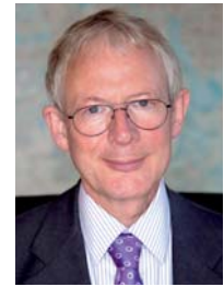
Stephan Weil Oberbürgermeister Landeshauptstadt Hannover