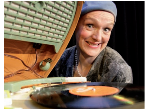
Fräulein Rose singt Schlager gegen das Vergessen

Die Rose natürlich! Anders als ihr Ruf finde ich Rosen überhaupt nicht kompliziert. Es sind tief verwurzelte Sträucher, die es einem auch verzeihen, wenn man sie mal falsch beschneidet und sie belohnen