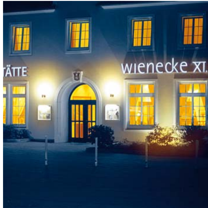
Außenansicht der Brauereigaststätte Wienecke XI.

Das ****Designhotel mit 280 Betten verfügt über 20 Tagungs- und Banketträume von 10 bis 1.000 qm. In der Kongresshalle stehen 1.600 qm nebst Terrassen im Außenbereich zur Verfügung. Diverse Räume lassen sich nach individuellen Anforderungen kombinieren. Die Gesamtfläche des CongressCentrums beträgt 4.500 qm.