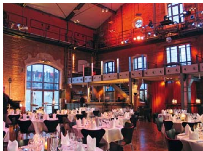
cavallo königliche Reithalle