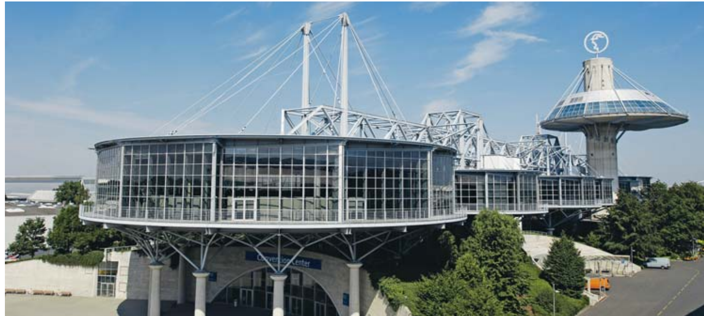
Außenansicht Convention Center