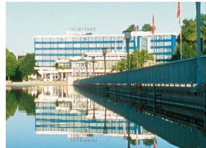
Maschsee mit Blick zum Courtyard Hotel

Direkt am Maschsee und nur wenige Gehminuten vom Stadtzentrum gelegen, ist dieses First Class Hotel mit 144 Gästezimmern, 5 Suiten sowie Sauna, Solarium und Fitnessraum ausgestattet. „Julian's Bar & Restaurant“ verwöhnt kulinarisch, und die Veranstaltungsräume mit eigener Terrasse laden zum Feiern und Tagen ein.