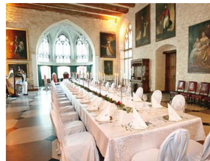
Tafel im Rittersaal

Die ehemaligen Pferdestallungen und die Kutschenremise wurden zu stimmungsvollen Restaurant- und Veranstaltungsräumen im Stil eines französischen Bistros aus dem späten 19. Jahrhundert umgestaltet. Bei schönem Wetter ist die Szenerie im romantischen Innenhof ein besonderer Genuss. Verschiedene Schloss- und Themenführungen, Turmaufstieg und Konzerte im romantischen Ambiente versetzen die Besucher in höfische Zeiten. Von Mai bis Oktober können weitere Räumlichkeiten im Schloss für exklusive Events angemietet werden.