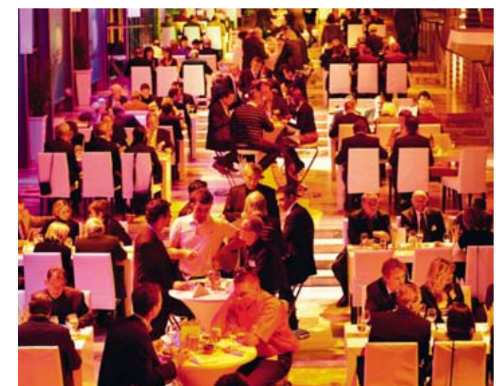
Event im Convention Center