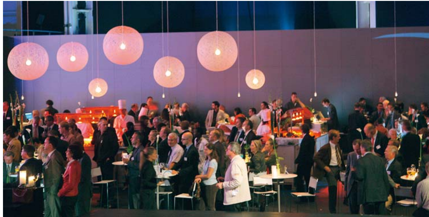
Event im Flugzeughangar