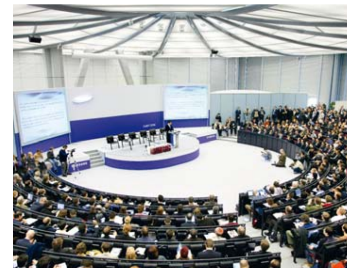
Vortrag im Convention Center