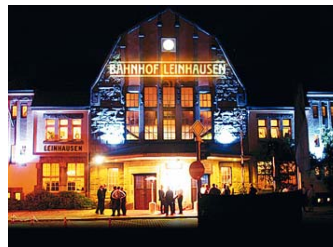
Musiktheater Bahnhof Leinhausen