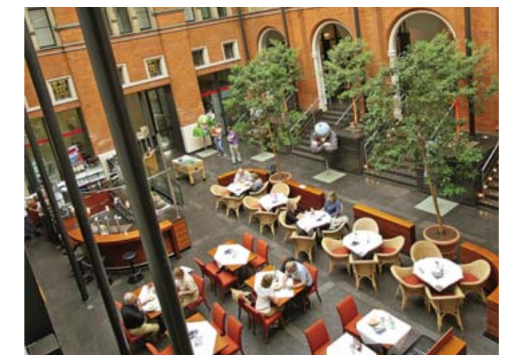
Lichthof im Alten Rathaus