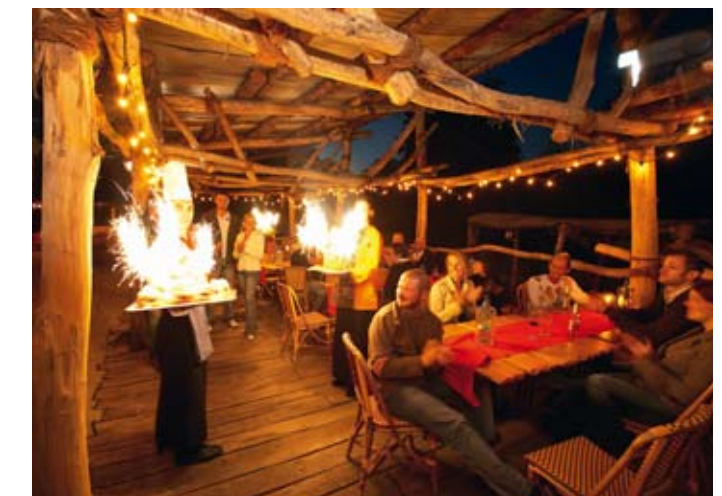
Abendveranstaltung am Sambesi