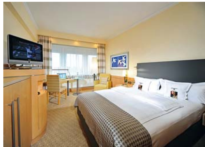
Businesszimmer, Best Western Premier Parkhotel Kronsberg

Das First Class Hotel liegt im Süden Hannovers, direkt neben der TUI Arena, dem Messegelände und der EXPO-Plaza. Es verfügt über 200 Zimmer, 3 Restaurants, 14 Veranstaltungsräume, Smokers Lounge, Bar, Schwimmbad, Sauna, Dampfbad und 400 kostenfreie Parkplätze. Im ganzen Haus ist High-Speed-Internet kostenlos verfügbar.