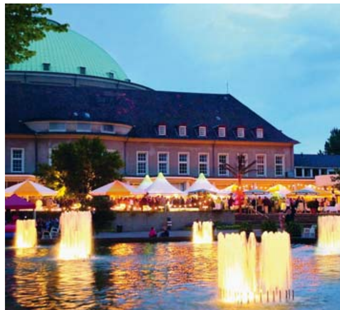
Veranstaltung im Stadtpark

auch noch mitten in der Stadt. Die Attraktivität Hannovers als grünste Großstadt Deutschlands lässt sich hier besonders intensiv erleben, denn das HCC grenzt direkt an den Stadtpark. Die anspruchsvolle Anlage, Schauplatz der ersten Bundesgartenschau 1951, eignet sich hervorragend für Open-Air-Events auf gehobenem Niveau. Hier verwöhnen ein stolzer Baumbestand, prächtige Blumenbeete, Fontänen und Skulpturen die Sinne. Und vom Rosencafé lässt sich die Schönheit von 140 Sorten der edlen Blume genießen. Vergleichsweise wild erscheint der Stadtwald Eilenriede, der sich auf der anderen Straßenseite ausdehnt. Auch der Erlebnis-Zoo Hannover ist zu Fuß in kurzer Zeit erreichbar. Trotzdem liegt das HCC nur wenige Stadtbahn- und Bushaltestellen vom Zentrum Hannovers entfernt. Gleichzeitig garantiert der nahe Messeschnellweg als direkte Verbindung zur Autobahn die schnelle Erreichbarkeit.