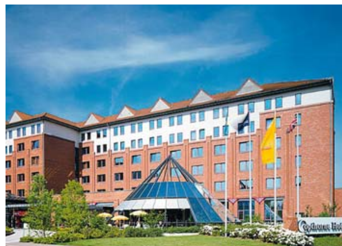
Cophorne Hotel Hannover

Als First Class Hotel verfügt das Cophorne über 222 exklusive, klimatisierte Gästezimmer, Suiten und Business-Appartments. Das im britischen Stil eingerichtete Restaurant bietet Wintergarten-Atmosphäre. Im Pub „The Dubliner“ wird zu Fish & Chips gepflegtes Guinness oder Kilkeny genossen. Entspannung bietet auch der Wellnessbereich „Splash – The Club“.