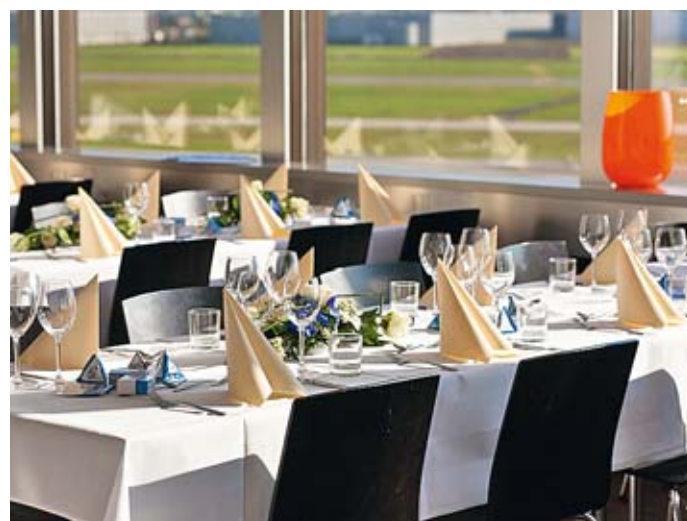
Über den Dächern des Flughafens: das Skylight

Veranstaltungen am Hannover Airport lassen sich mit Flughafenentouren kombinieren – und mit Rundflügen im historischen Antonov-Doppeldecker. Auf dem Campus des Flughafens befinden sich die Hotels Holiday Inn Hannover Airport und Maritim Airport, die ein vielfältiges Zimmerkontingent in verschiedenen Preiskategorien und erstklassige Serviceleistungen bieten.