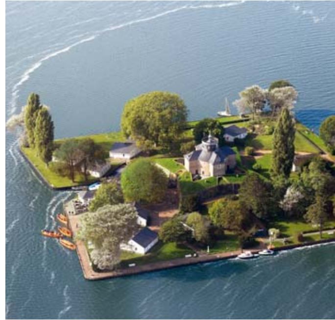
Insselfestung Wilhelmstein, Steinhuder Meer