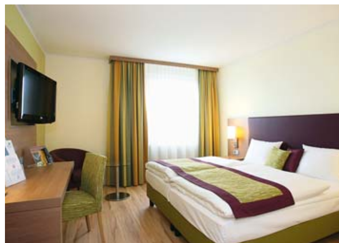
Doppelzimmer, Congress Hotel am Stadtpark

Direkt am Stadtpark, zugleich im Grünen und am Rand der City von Hannover, befindet sich dieses First Class Hotel, das 258 Zimmereinheiten bietet. Alle Zimmer sind modern und mit viel Komfort eingerichtet. Eine Besonderheit ist der höchste Pool der Stadt, der Panorama 17. Hier ist von der 17. Etage aus eine beeindruckende Aussicht zu genießen.