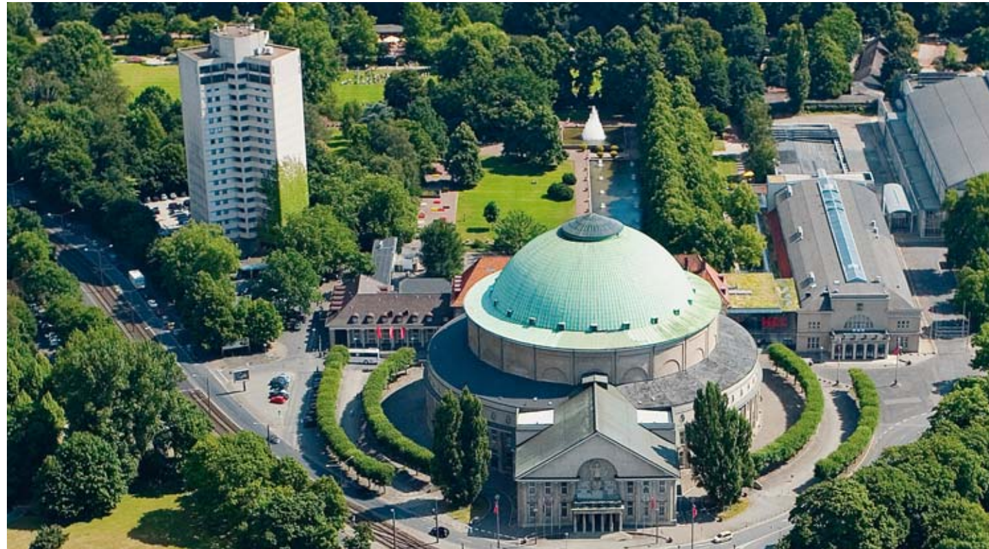
Luftaufnahme Hannover Congress Centrum (Mitte) und Congress Hotel am Stadtpark (links)