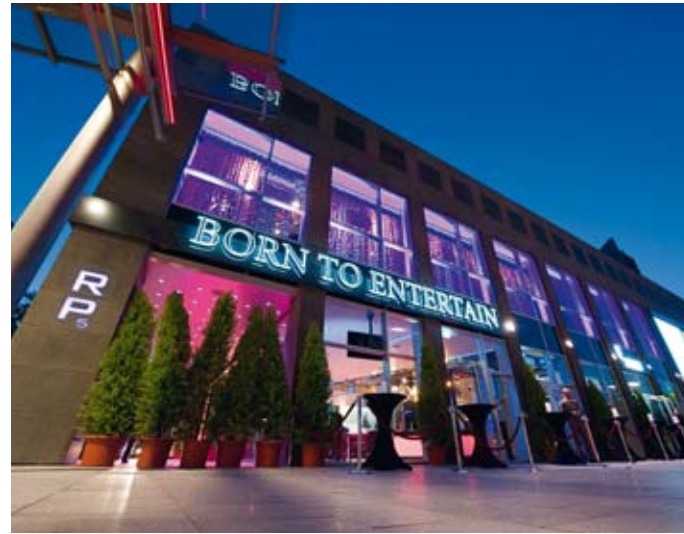
RP5 Entertainment Center