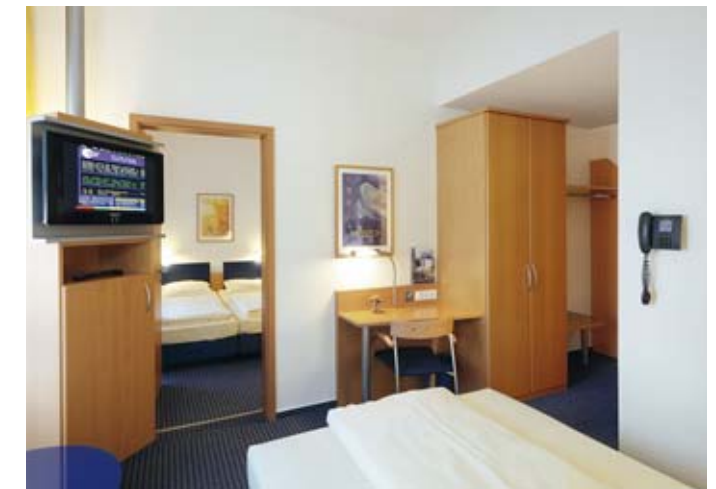
Zimmeransicht, Designhotel Wienecke XI. Hannover

Im Jahr 2000 eröffnet, liegt dieses First Class Hotel direkt am Landschaftsschutzgebiet Wülfeler Leineauen und unweit des Messegeländes. Es verfügt über 280 Betten in 140 Zimmern, inklusive zweier behindertengerechter Zimmer und einer Hotelbar. Die Brauereigaststätte und der Biergarten bieten gediegene Gastronomie mit Niveau.