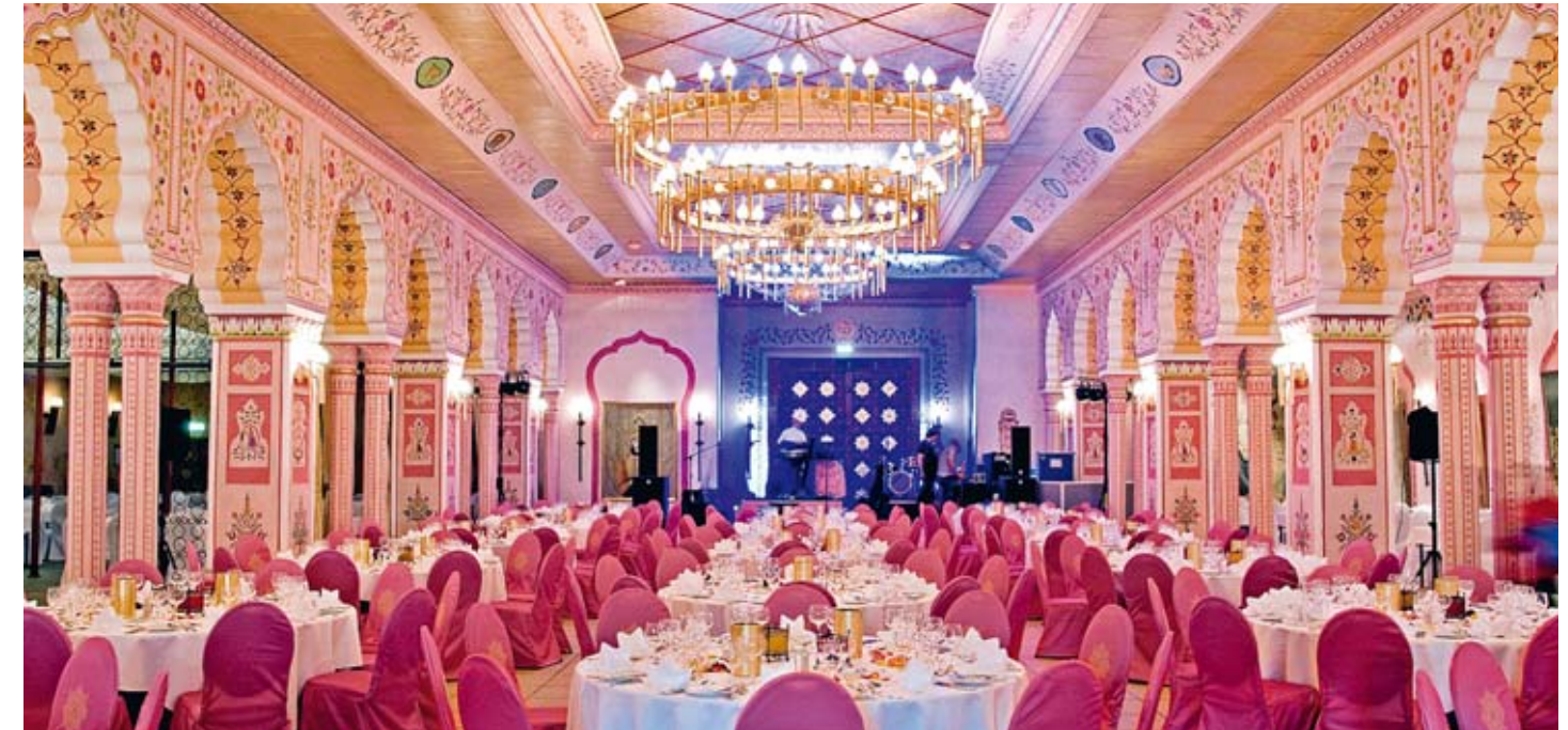
Festbankett im Prunksaal des Maharadschas