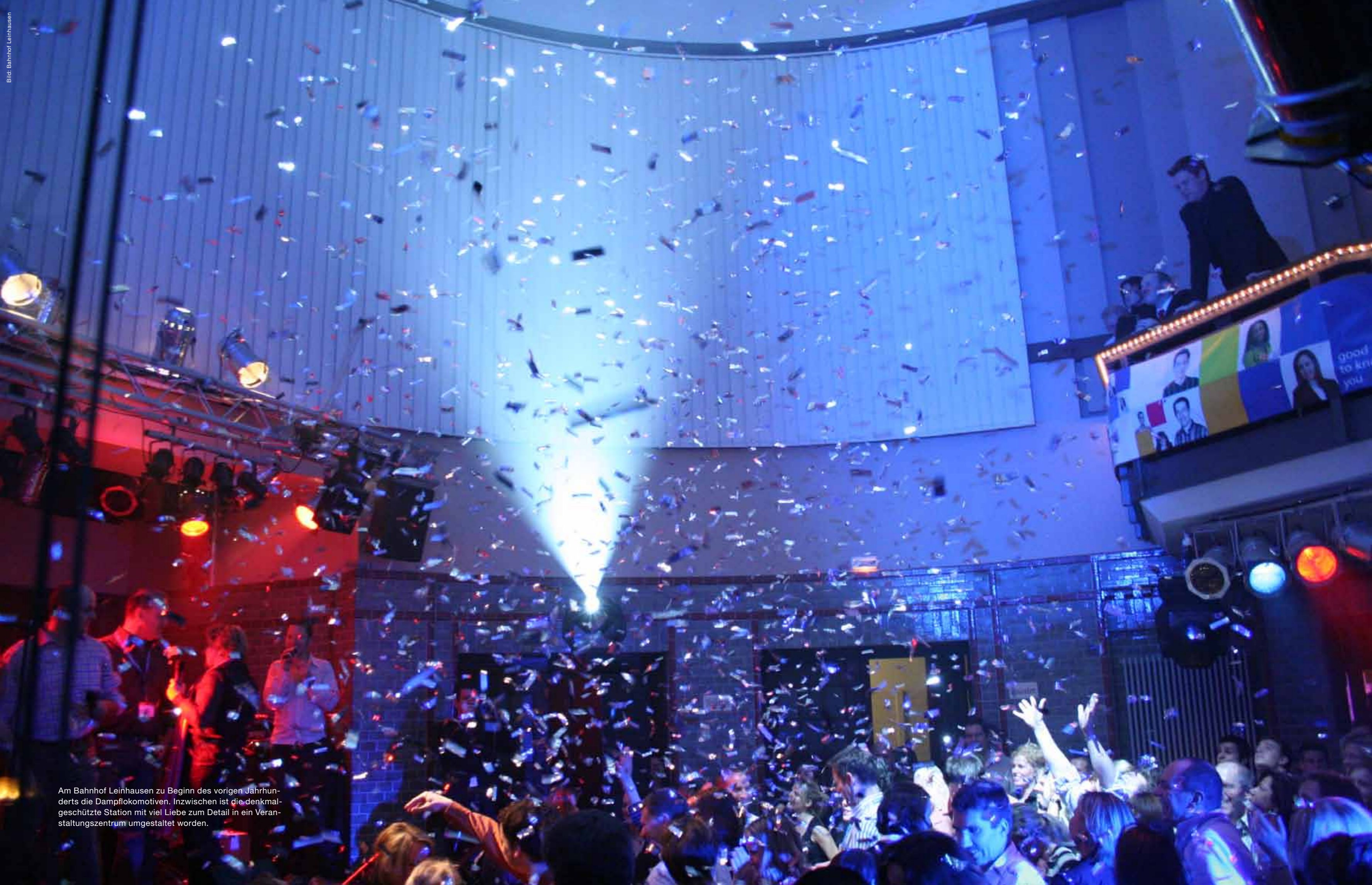
Am Bahnhof Leinhausen zu Beginn des vorigen Jahrhunderts die Dampflokomotiven. Inzwischen ist die denkmalgeschützte Station mit viel Liebe zum Detail in ein Veranstaltungszentrum umgestaltet worden.