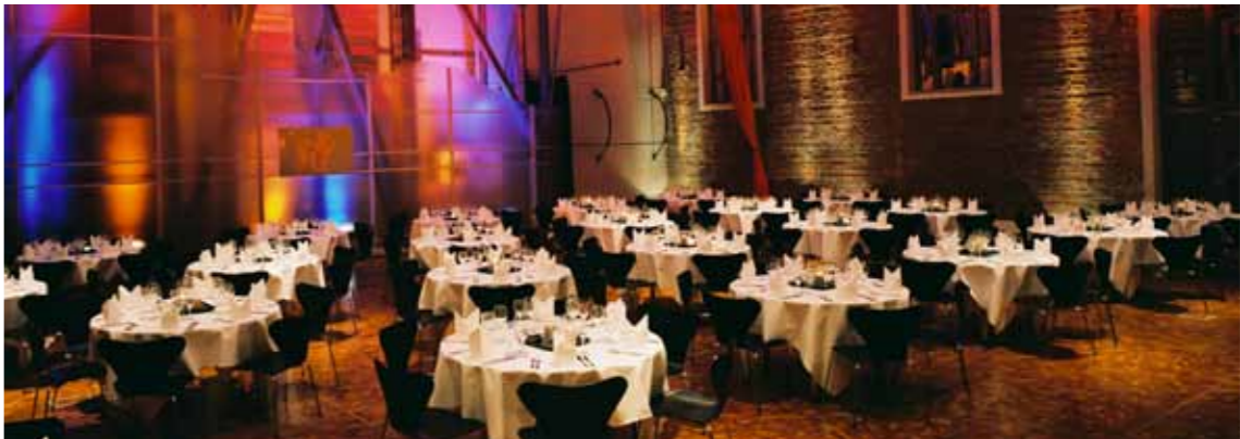
Einen einzigartigen Rahmen für gesellschaftliche Highlights, Businessvents und Medienereignisse stellt das Loftambiente im „Cavallo – Königliche Reithalle“, der letzten erhaltenen Reithalle der königlichen Kavallerieschule, dar.