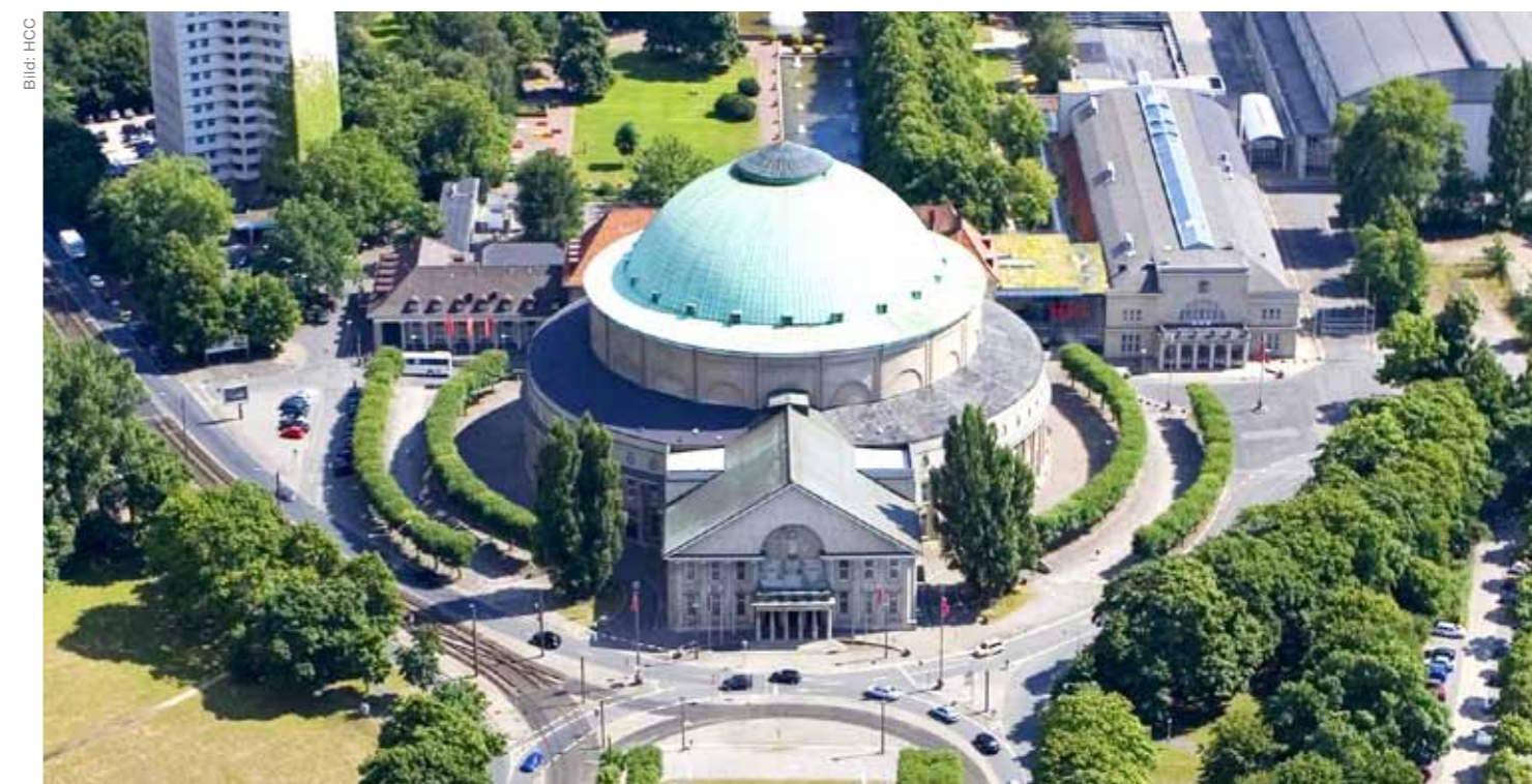
Umgeben vom Stadtpark und der Eilenriede liegt das HCC mitten im Grünen, gleichzeitig aber zentrumsnah und verkehrsgünstig. Sieben Säle, darunter der wunderschöne Kuppelsaal in der fast 100 Jahre alten Stadthalle, stehen hier u.a. zur Verfügung.

Die Lage des Congresscentrum Wienecke XI. ist einzigartig: sehr zentral und bestens angebunden – mit Stadtbahnanschluß direkt vor der Tür – von allen Autobahnen bestens erreichbar und doch blickt man von der großen Kongresshalle unmittelbar in das Landschaftsschutzgebiet der Wulfeler Leineauen.