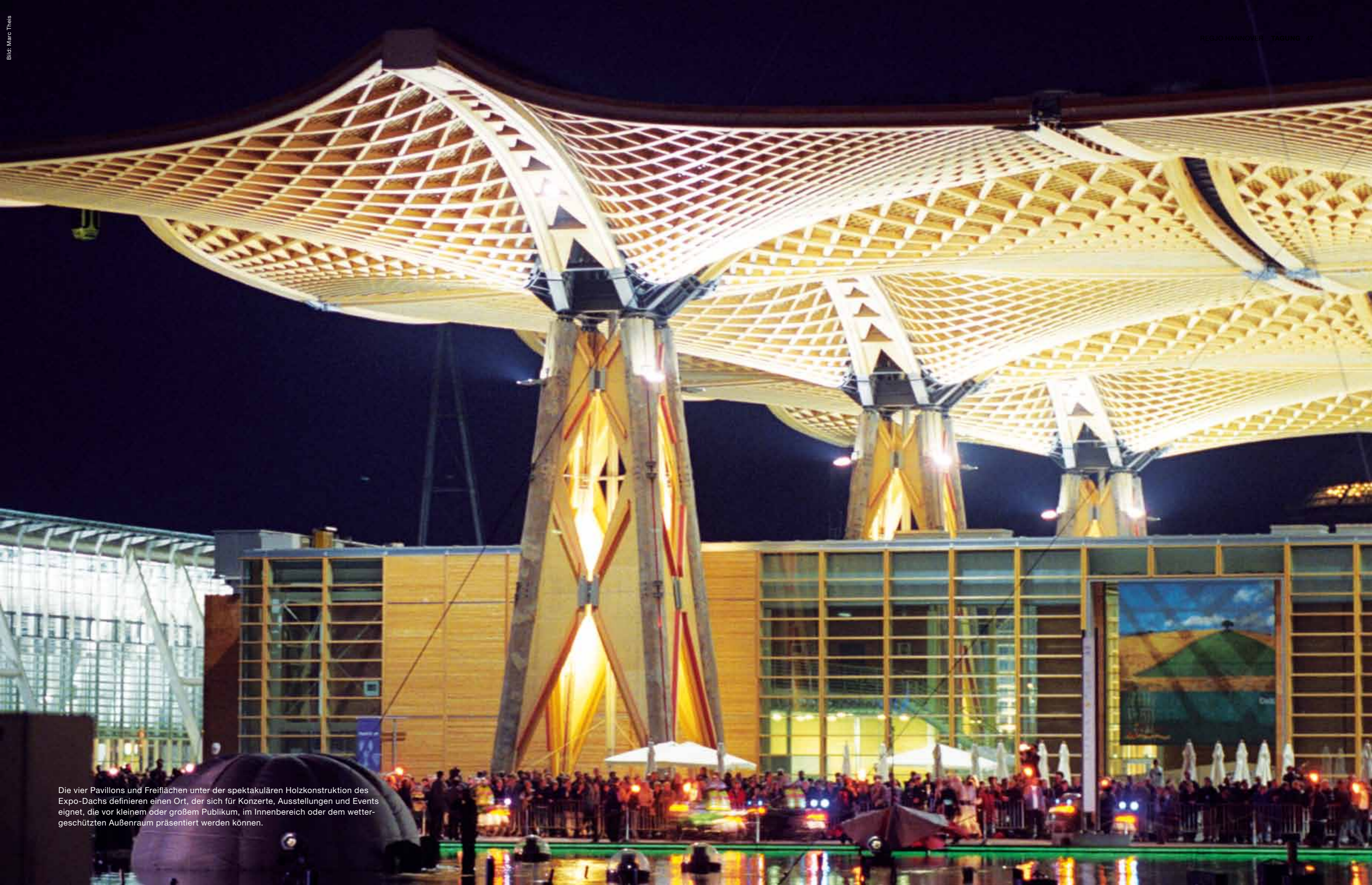
Die vier Pavillons und Freiflächen unter der spektakulären Holzkonstruktion des Expo-Dachs definieren einen Ort, der sich für Konzerte, Ausstellungen und Events eignet, die vor kleinem oder großem Publikum, im Innenbereich oder dem wettergeschützten Außenraum präsentiert werden können.