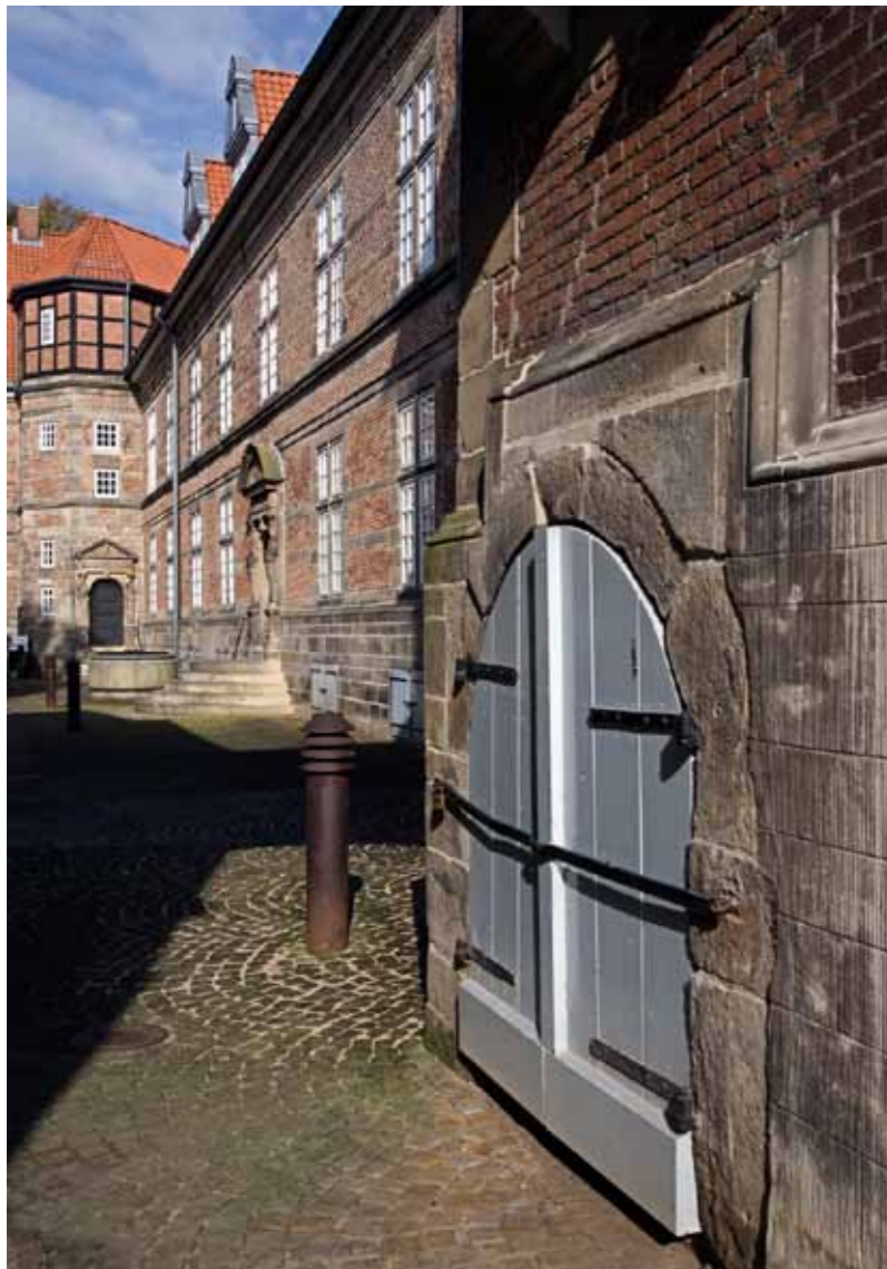
Wunderschön und betrieben von der Stiftung Kulturregion Hannover: das Weserrenaissance-Schloss Landestrost in Neustadt am Rübenberge.