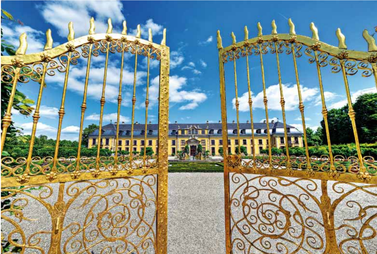
Herrenhäuser Gärten: Für elegante Festlichkeiten eignen sich der freskengeschmückte Saal und die reich verzierten früheren Gemächer der Kurfürstin Sophie im Galeriegebäude, ebenso die Orangerie und das Hardenbergsche Haus, eines der letzten Barockgebäude der Stadt.