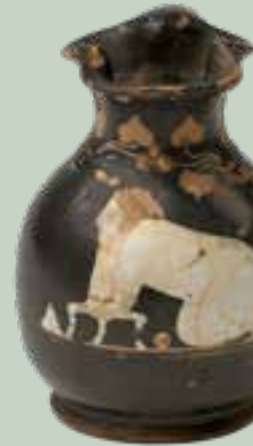
Choenkännchen, Attika, 1. Hälfte 4. Jh. v. Chr., Museum August Kestner