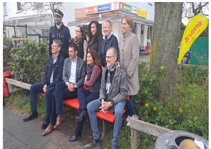
Eröffnung der „Roten Bank“ im Heideviertel, 24. März 2025