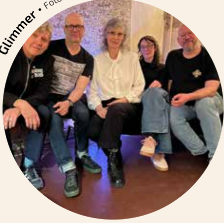
Glimmer • Foto: © Nils Meyer