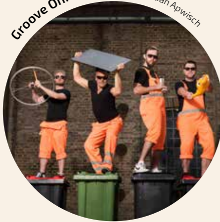
Groove Onkels