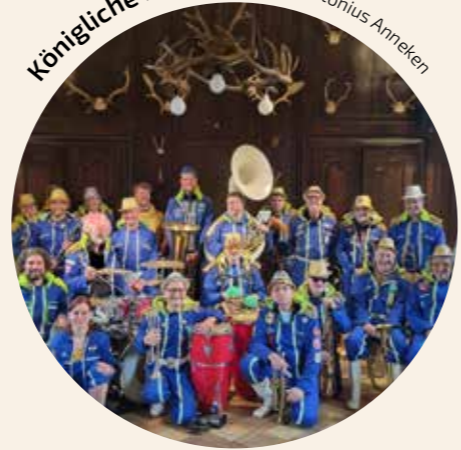
Königliche Braut