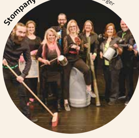
Stompany • Foto: © Annett Wonneberger