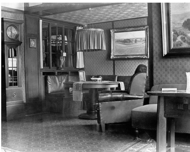
Einer der Wohnräume der Familie Rothschild in der Eichendorffstraße 5.