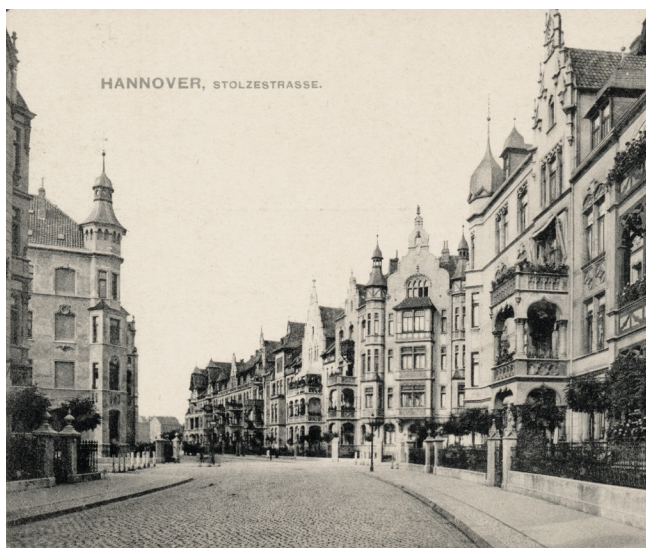
Blick in die Stolze Straße um 1900