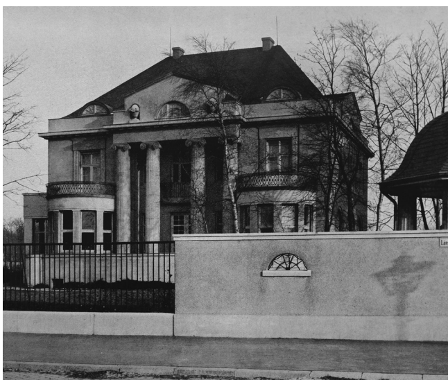
Villa Julius Gumpel, Zeppelinstraße 6, um 1915