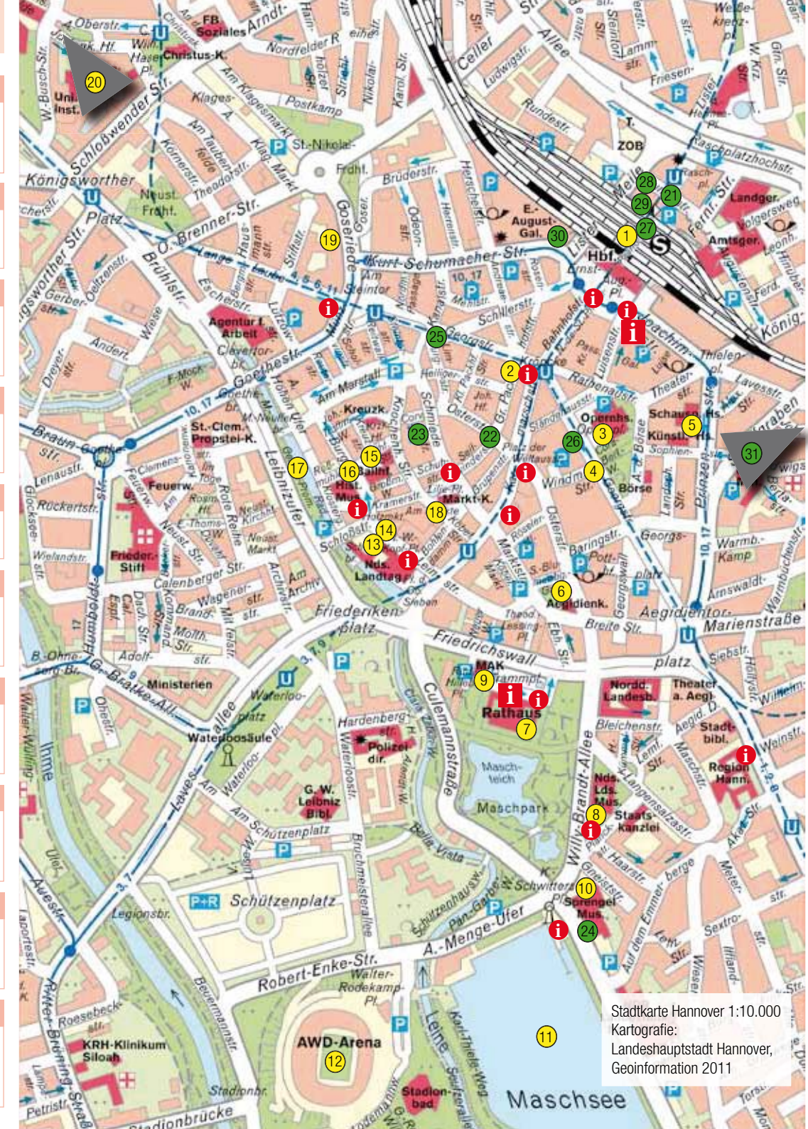
Stadtkarte Hannover 1:10.000 Kartografie: Landeshauptstadt Hannover, Geoinformation 2011

Barocke Pracht, Wasserspiele und die Grotte von Niki de Saint Phalle im Großen Garten, botanische Schätze und Schauhäuser mit Orchideen im Berggarten – unvergesslich zu jeder Jahreszeit!