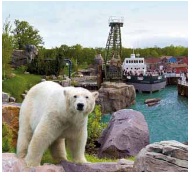
Blick auf die Kanada-Landschaft Yukon Bay!