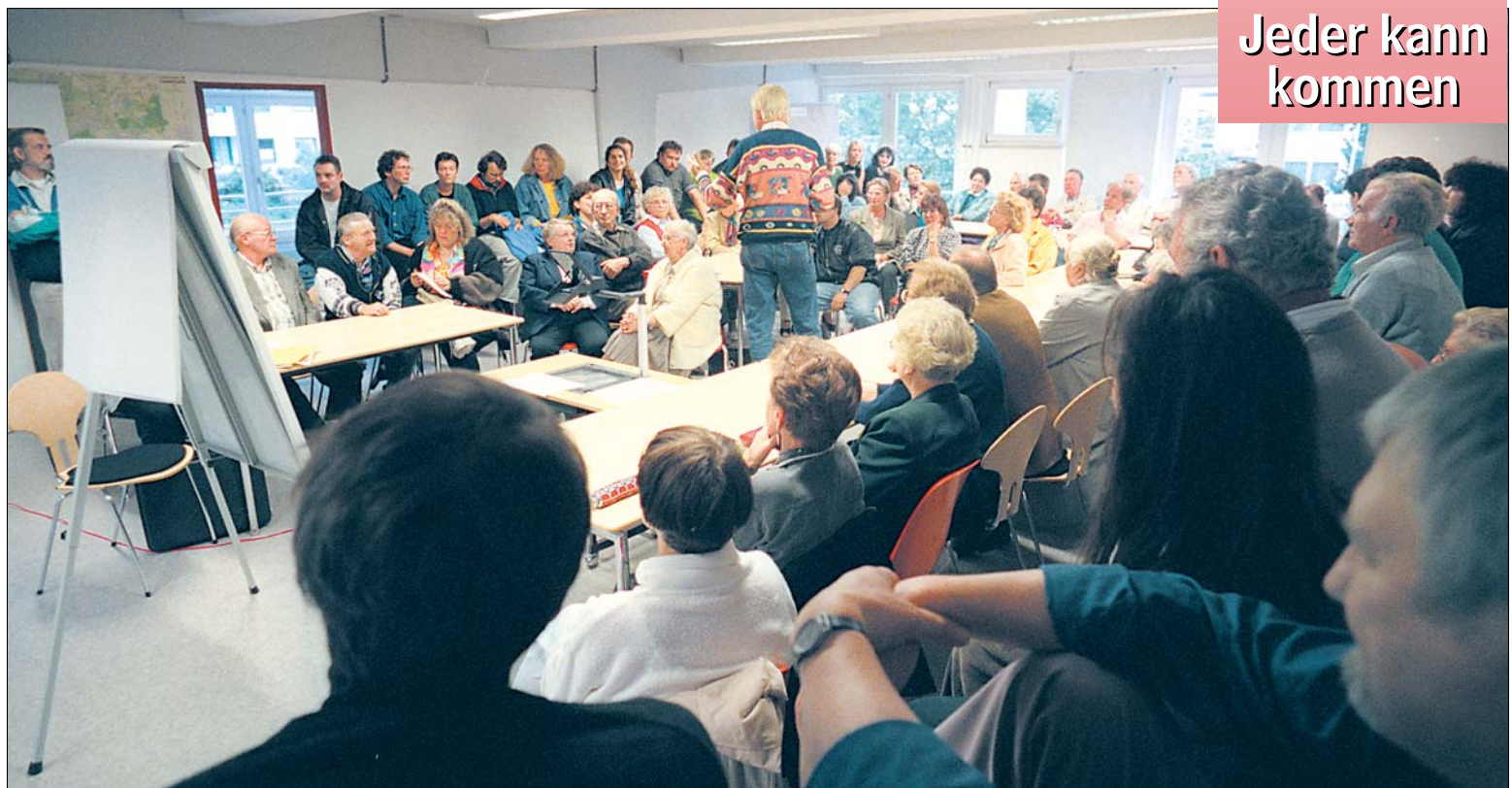
Die Vahrenheider läßt die Zukunft ihres Stadtteiles nicht kalt: Dicht gedrängt saßen rund 80 Menschen in der ersten Sitzung des Bürgerforums.

Was vor 12 Jahren im Kleinen begann, hat sich bis heute mächtig entwickelt – die Nachbarschaftsinitiative Vahrenheide. Die Geschichte des Vereins und welche Angebote sie den Menschen im Stadtteil machen, lesen Sie auf Seite 4