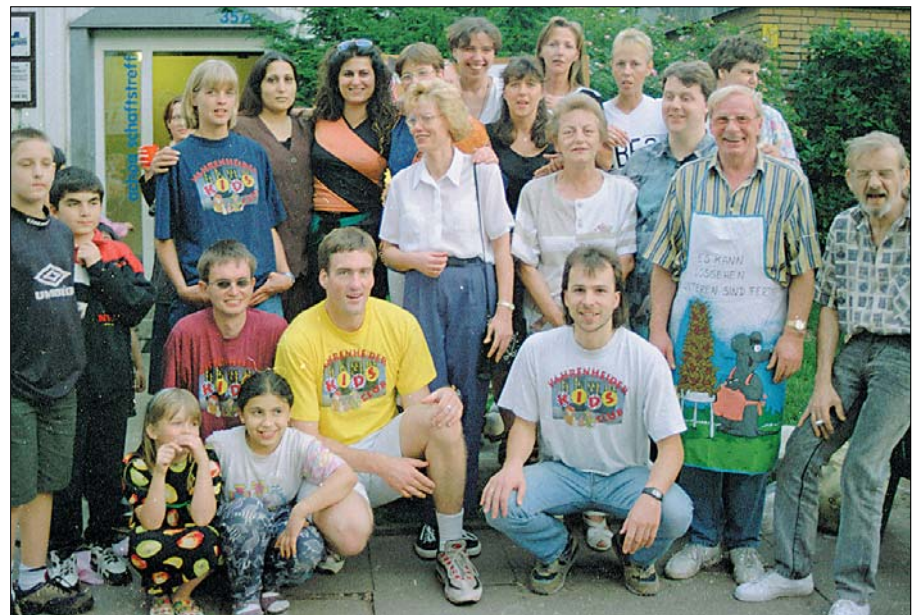
Das Team der Nachbarschaftsinitiative