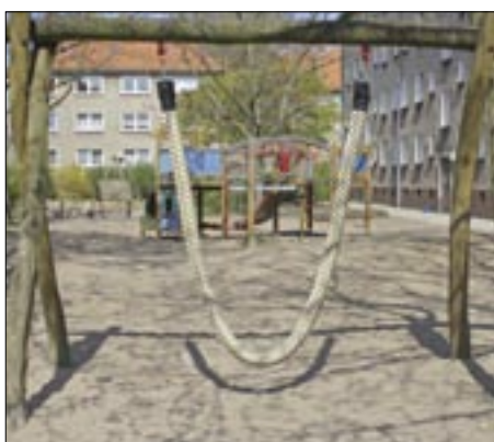
Die Spielplätze sind unterschiedlich attraktiv.

бюро планирования получили материалы для обширного Freiraumentwicklungskonzept (программы развития свободных площадей). Между тем их предложения были оценены. Теперь, после того, как hannoversкое Büro für Freiraumplanung выиграло конкурс, может быть начато участие жителей. Это предусматривается как для специальных мест для определённых групп жителей, к примеру, для детей или для пожилых людей, так и для тех мест, для которых первоначально только принимаются предложения и цели формулируются.