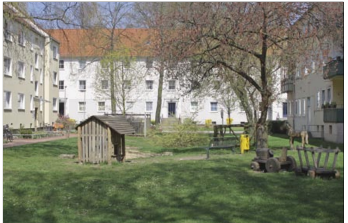
Grün ist die vorherrschende Farbe. Doch nur wenige Freiflächen zwischen vielen Häusern werden von den BewohnerInnen genutzt.

Kloten sieht im Sanierungsgebiet „ein Riesenpotential, das noch nicht genutzt wird.“ So sei Stöcken zwar umgeben von Grünflächen, aber sowohl die Leineau als auch der Stöckener Friedhof können nur über Umwege erreicht werden. Zwischen den Wohnhäusern gibt es viele Grünflächen, die selten als Garten oder zum Spielen genutzt werden. Für Kinder fehlen im Sanierungsgebiet Treffpunkte und Flächen zum Beispiel fürs Skaten und BMX-Fahren. Die bestehenden Spielplätze sollen neu gestaltet werden. Kloten rechnet damit, dass die ersten Projekte im kommenden Jahr umgesetzt werden.