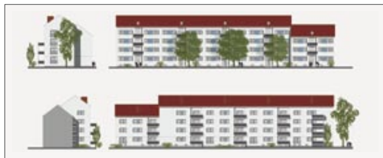
Bild oben: Die Häuser in der Weizenfeldstraße 1 bis 9 benötigen eine Dämmung. Bild unten: So sollen die Fassaden nach der Modernisierung aussehen.