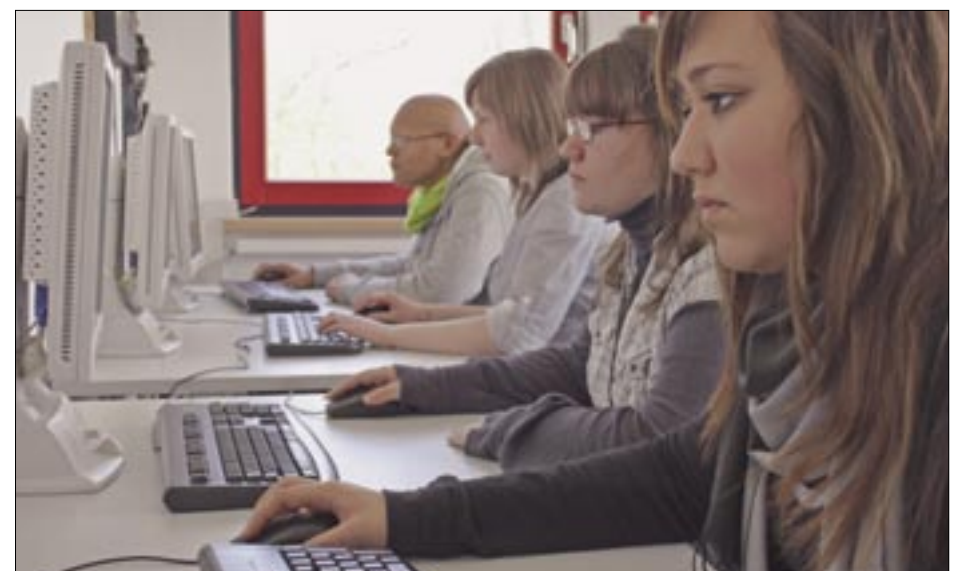
Viele Infos über Berufe und Ausbildungsplätze finden sich im Internet. Computerarbeit war daher fester Bestandteil der Projektwoche zum Thema Berufsinformation und Bewerbungstraining.

Bu iki görevli hem programın konseptiyon tertipi ile hemde konu tasarımı için yetkililer. Hazır olan bütçeden gençlere, anne ve babalara, okullara, firmalara, müesselere ve okullara uygun bir şekilde destekde bulunup, perspektiv olarak okuldan iş hayatına pürüzsüz şekilde başlama imkanı verecek projeler yapılabilecek. „Ausbildungsoffensive Stöcken“ bir network forumu olarak anlanacak. Uzun süreli başarı müesselerin, okulların, tüccarların, iş verenlerin semtteki kuruluşların birlikte kooperasyonları ile sağlanacak. Arbeitsagentur, Jobcenter, semtte olan ve başka kuruluşların, mesela sanayi ve ticaret odaları ile çalışmalarını geliştirmek. Proje sonunda „Okuldan- iş hayatına geçiş“ konusu daha dikkatli gündeme, ortaya alınıp ve katkıli aktörler bağımsız olarak yürütebilecek.