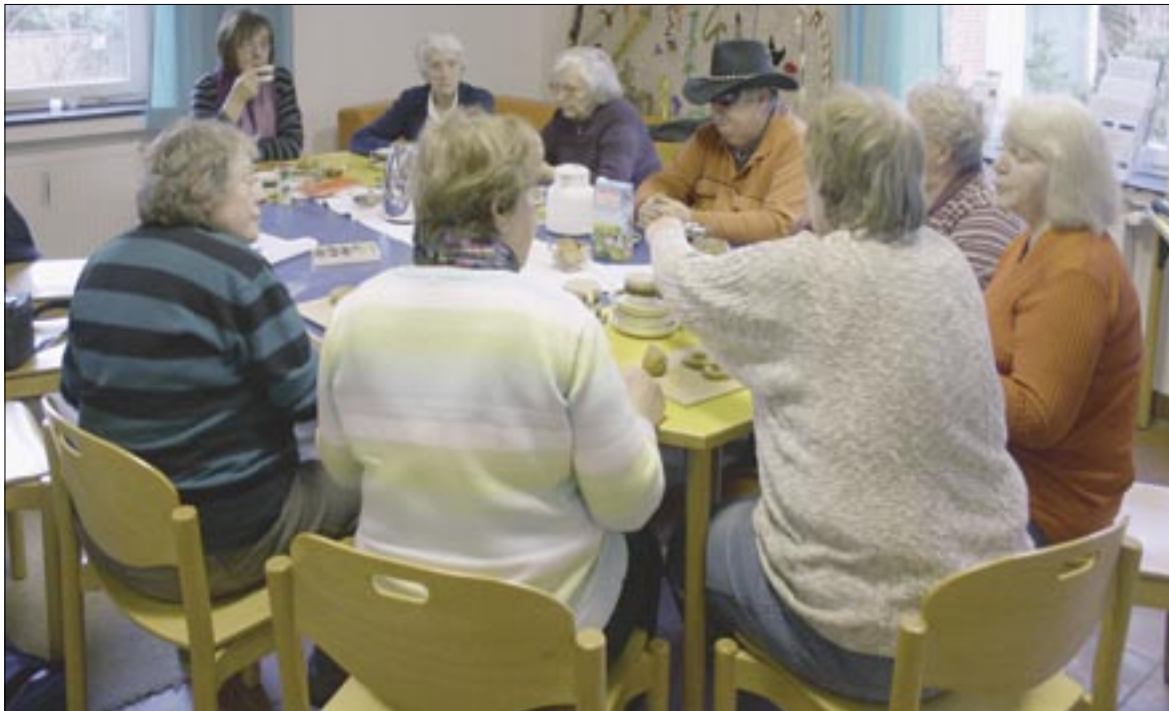
Reger Austausch und jede Menge Kreativität: Das Kulturcafé hat viele Stammgäste, ist aber auch offen für Interessierte.

Kultur, Essen und Beratung – das Angebot des „Wohnwinkel“ ist vielfältig