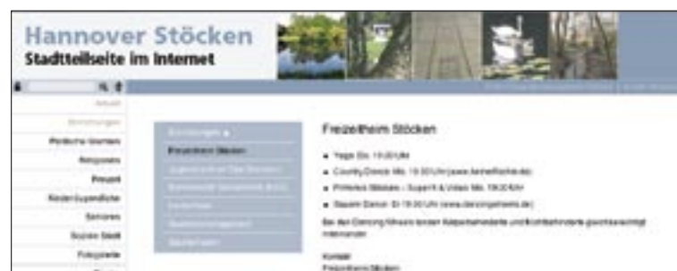
Klarer Aufbau, aktuelle Informationen: Die neue Stöcken-Homepage ist jetzt online.

endes Projekt“: Jederzeit können Änderungen und neue Inhalte eingearbeitet werden. Ihr schwebt vor, dass sich eine feste Gruppe von BewohnerInnen bildet, die die Seite künftig pflegt. Wer daran Interesse hat, kann sich gerne im Quartiersmanagement unter der Rufnummer (05 11) 2 79 25 50 melden.