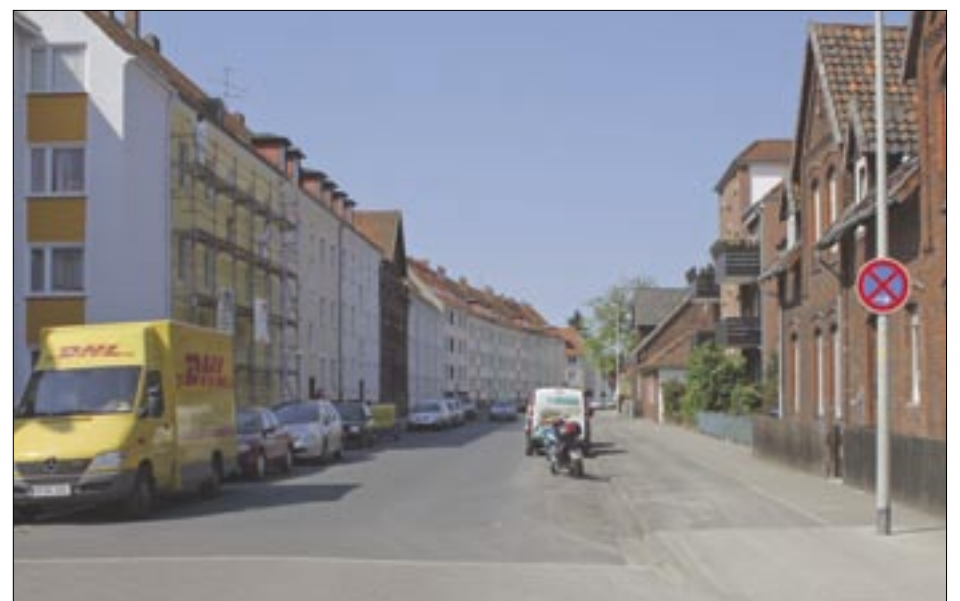
Im Sanierungsgebiet Stöcken gibt es viele breite Straßen mit einigen wenig genutzten Flächen.

Kloten şehir onarım bölgesinde „henüz kullanılmayan çok büyük potansiyel“ görüyor. Stöcken için etrafı yeşil sahayla dolu, ama Leineau ya, Stöcken mezarlığına dolaylı yollardan ulaşabiliyor. Binalar arasında bulunan yeşil sahalar ne bahçe olarak nede oynamak için yoğun kulanıma uygun. Çocuklara şehir onarım bölgesinde toplanma yeri yada misal olarak skate ve BMX sürmeye müsait yer eksik. Semtteki çocuk oyun sahaları yenilenecek. Gelecek sene bir kaç projenin gerçekleşmiş olacağını öneriyor Kloten.