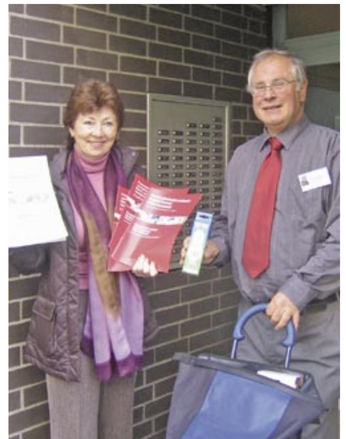
Die StromsparberaterInnen haben Tipps und Energiesparprodukte dabei.

In diesem Jahr werden den Haushalten Energiesparprodukte wie Energiesparlampen im Wert von bis zu 40 Euro kostenlos zur Verfügung gestellt. EmpfängerInnen von Arbeitslosengeld II oder Sozialhilfe erhalten Produkte im Wert von bis zu 70 Euro. Die StromsparberaterInnen beraten auch in russischer oder türkischer Sprache. Ziel ist es, den Stromverbrauch in Hannover zu senken und die privaten Haushalte finanziell zu entlasten. Beratungstermine können unter Telefon (05 11) 60 09 96 34 vereinbart werden.