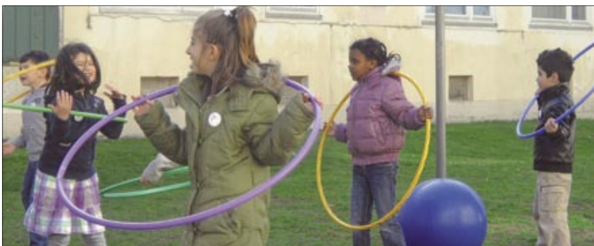
Schwungvoll ging's zu auf dem Weltgesundheitstag. Mit den Hula Hoop-Reifen hatten schon ihre Eltern gespielt.