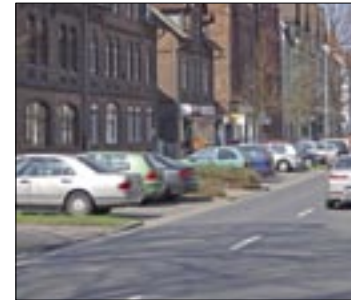
Viele Läden liegen weit auseinander.

Markt am Standort bleibt. Die vergangene Gewerberunde fand am 20. Mai im Waldgasthaus Entenfang statt. Unter anderem wurde über einen Gewerbestandteilplan sowie über eine Internetseite für das Gewerbe in Stöcken beraten. Künftig ist auch daran gedacht, über Themen wie Neuerungen im Steuerrecht oder die Finanzierung von Investitionen zu sprechen. Die Gewerbeberater Jarnot und Gutzmer können bei der Planung der Veranstaltungen auf jahrelange Erfahrungen in anderen Stadtteilen wie Hainholz oder Limmer zurückgreifen.