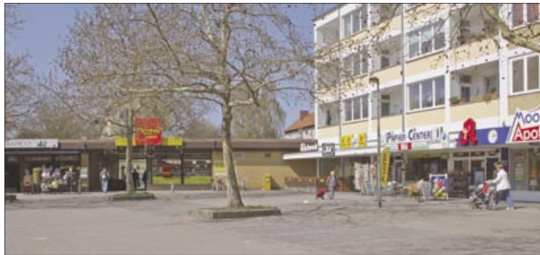
Großer Platz, wenig Sitzgelegenheiten: Die Geschäftsleute am Stöckener Markt wünschen sich mehr Bänke.