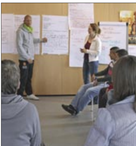
Wie präsentiere ich mich möglichst vorteilhaft? Von der Gruppe wurde ein feed-back gegeben.

После окончания проекта тема „переход от школы в профессию“ в Stöcken должна быть взята сильнее во внимание и осуществляться участниками дальше уже самостоятельно.