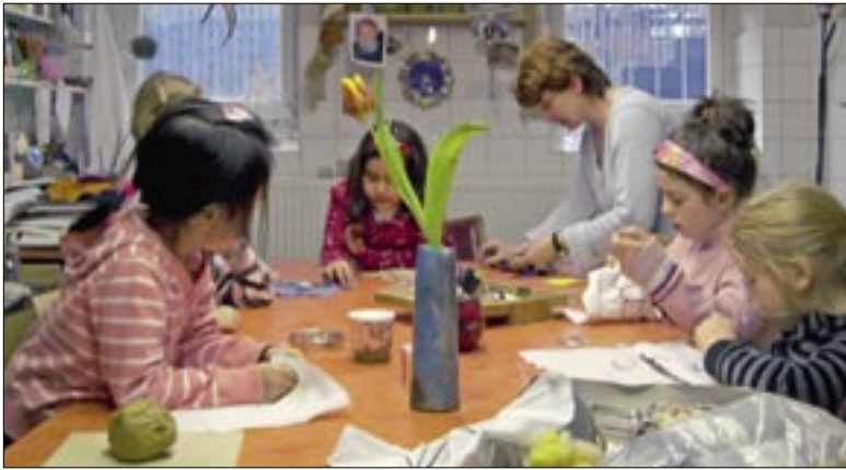
Mit Feuereifer dabei: Kinder in der Kunstschule „Galerie Spielraum“.

Auch für Erwachsene bietet die „Galerie Spielraum“ Kurse an: An jeweils acht Abenden arbeiten die TeilnehmerInnen dieses Jahr ebenfalls zum Thema „Porträt“. Die Gebühr beträgt 30 Euro pro Monat. Immer mittwochs von 15.30 bis 17 Uhr findet zudem ein Malkurs für Mütter in der Kita der Corvinusgemeinde statt. Die Teilnahme ist kostenlos. Wer sich anmelden oder weitere Informationen erhalten möchte, kann sich an Barbara Gschwendtner unter der Rufnummer (05 11) 2 28 13 61 wenden.