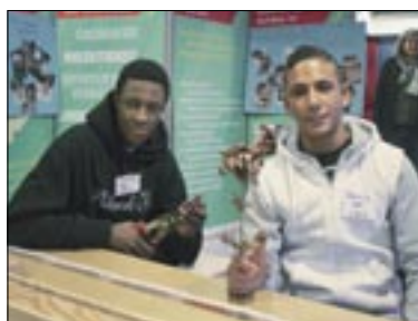
Viel PoWEr: Projekte im Freizeitheim.