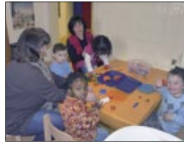
Neue Räume für kleine „Glühwürmer“.

Die Einrichtung wird mit 60.000 Euro jährlich aus der Stadtkasse finanziert. Die Summe setzt sich aus Elternbeiträgen des Jugendamtes, dem Mietzuschuss und dem