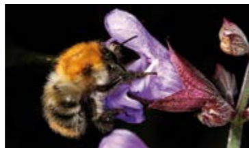
Steinhummel (oben links) Helle Erdhummel (oben rechts) Ackerhummel (unten links)