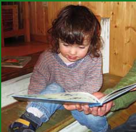
Bilderbücher tragen dazu bei, dass Kinder die Welt der Sprache entdecken.