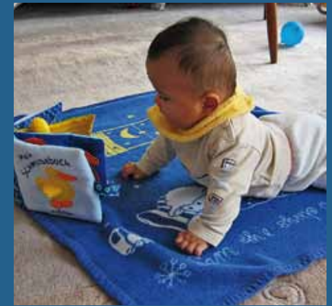
Eine Ringassel oder ein kleines Bilderbuch aus Stoff fordern zum Greifen und Entdecken auf.