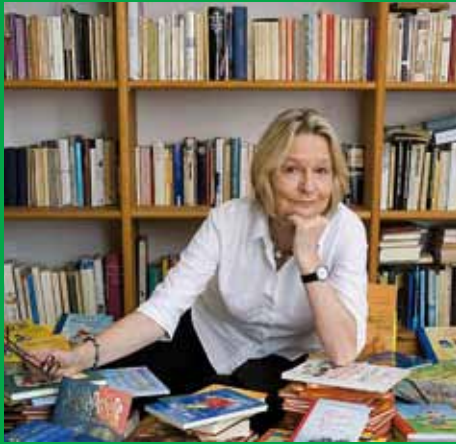
Die bekannte Kinder- und Jugendbuchautorin Kirsten Boie ( www.kirsten-boie.de ) ist Ehrenmitglied von Lesestart Hannover e.V.