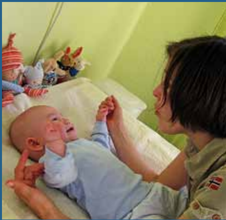
Beim Wickeln schaut Ihr Kind Sie an und lauscht aufmerksam Ihrer Stimme.