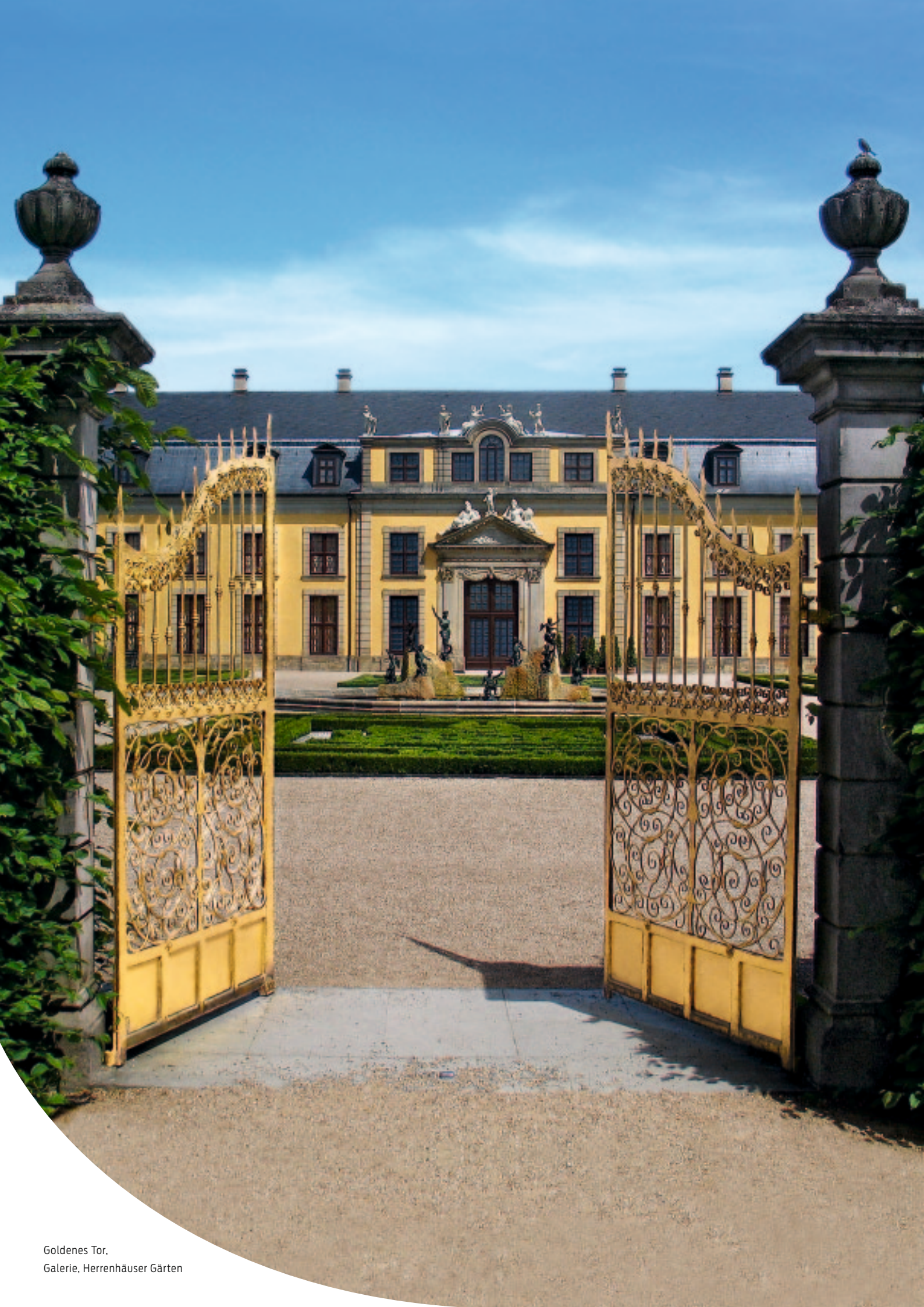
Goldenes Tor, Galerie, Herrenhäuser Gärten