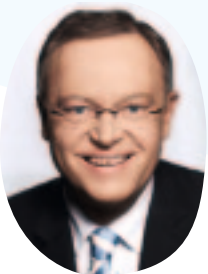
Stephan Weil, Niedersächsischer Ministerpräsident

„Blantyre Arts Festival would recommend that Hannover City must be ‚UNESCO City of Music‘ as it has done and is still doing a tremendous contribution to develop music and creative industry to other Cities and in particular with Blantyre Arts Festival in Malawi.“