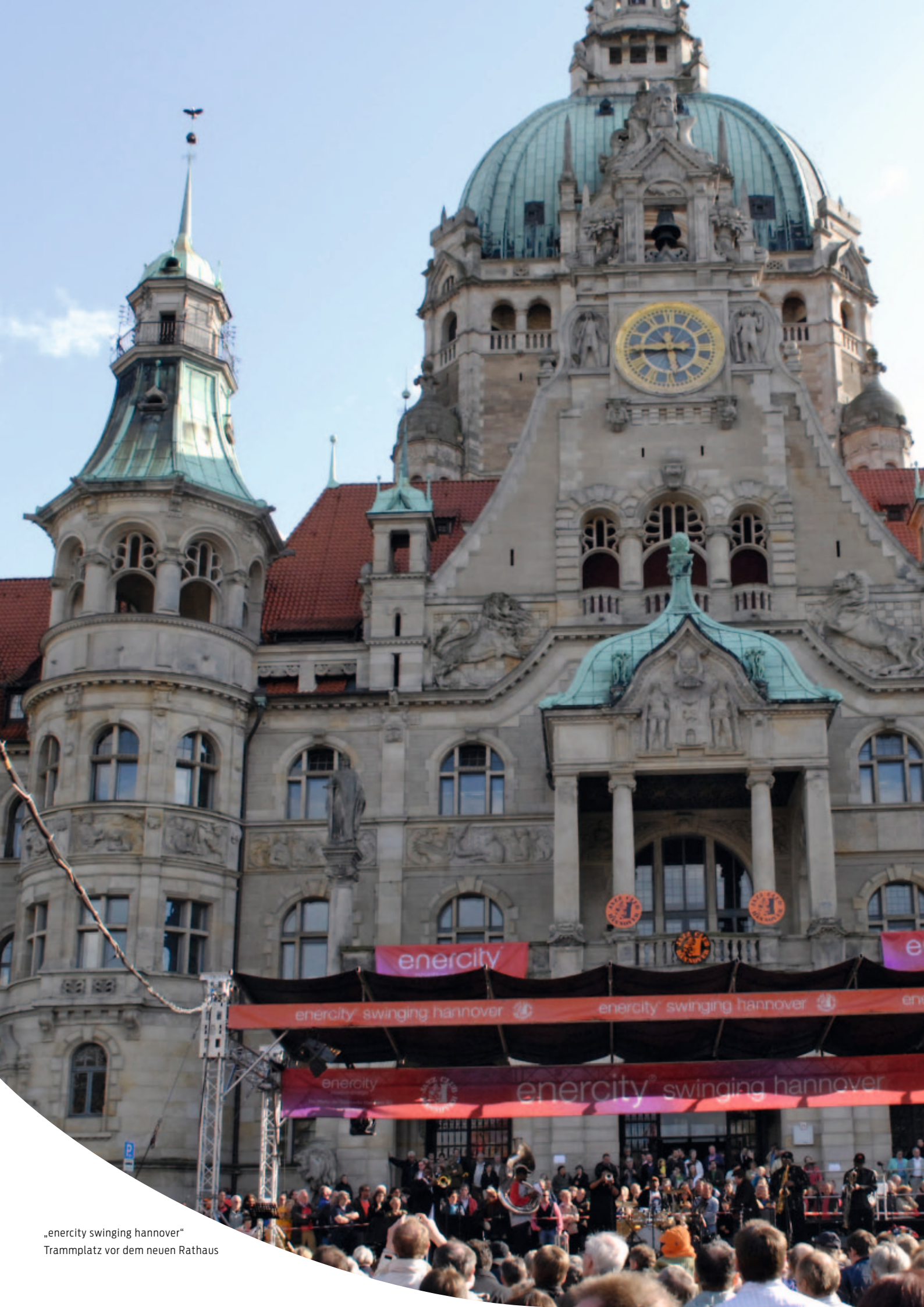
„enercity swinging hannover“ Tramplplatz vor dem neuen Rathaus