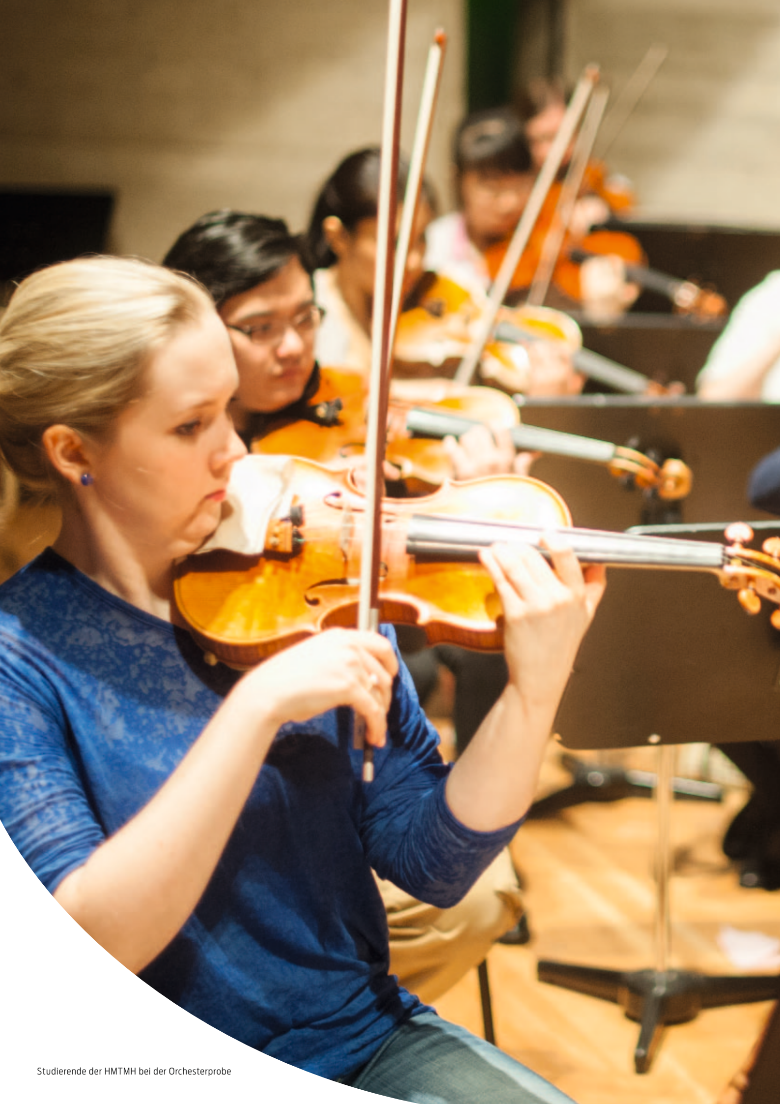
Studierende der HMTMH bei der Orchesterprobe