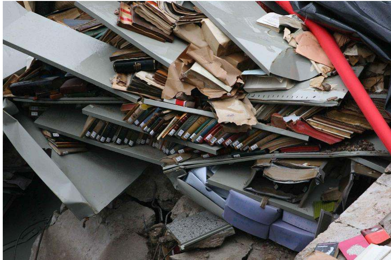
Einsturz des Stadtarchivs Köln