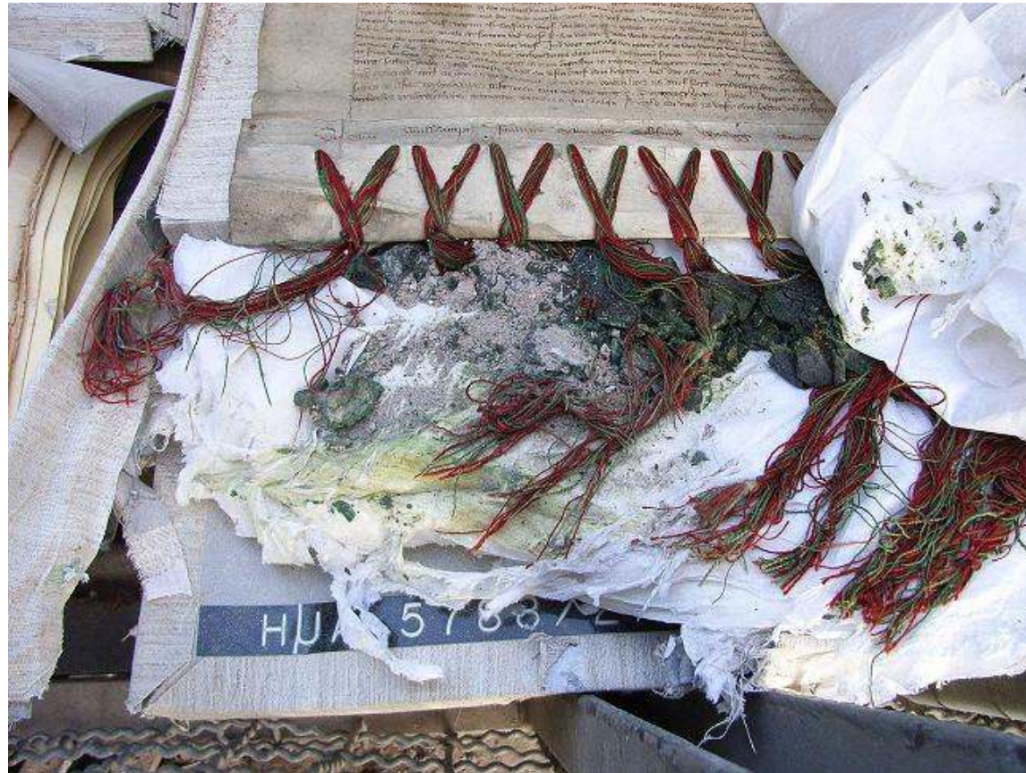
Beschädigte Kölner Urkunde