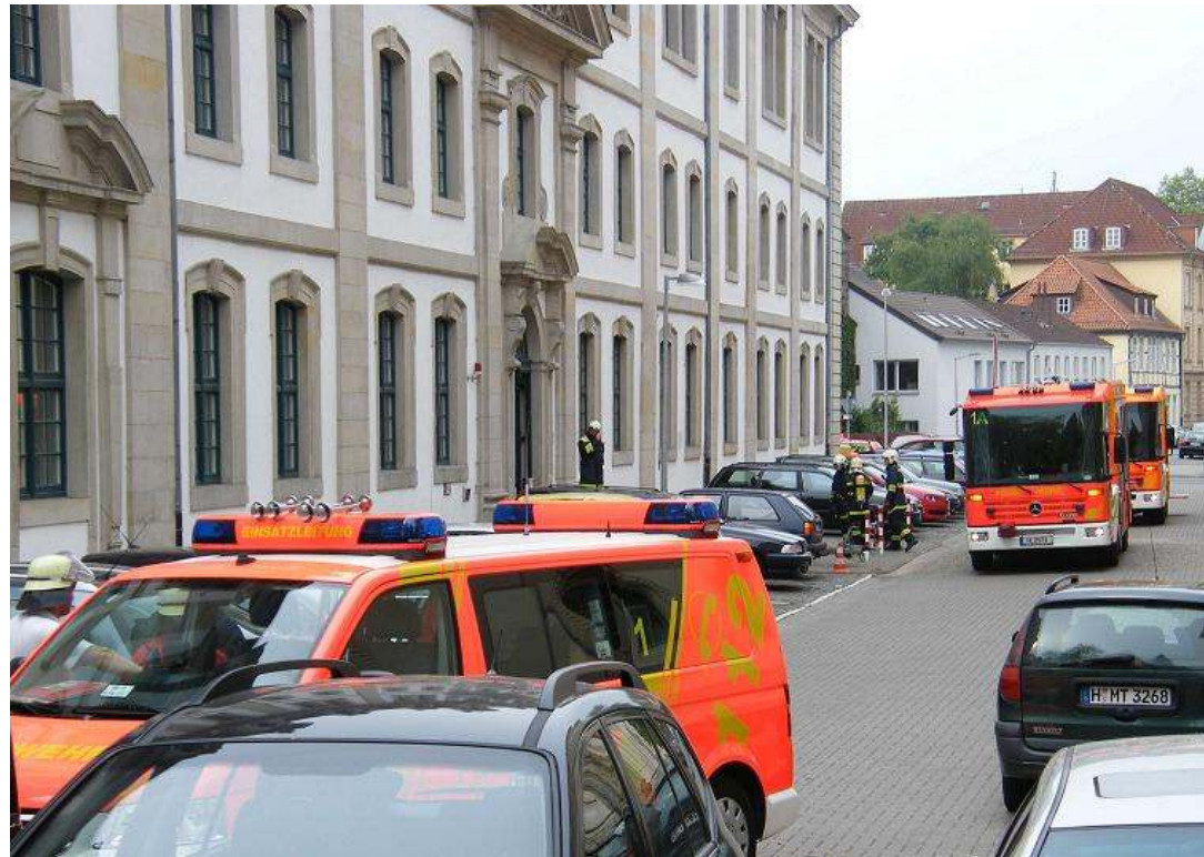
Einsatzübung der Feuerwehr Hannover am Hauptstaatsarchiv