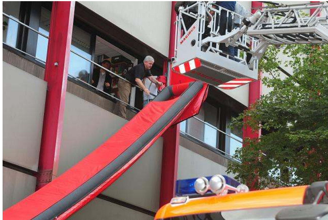
Einsatzübung der Notfallrutsche der Gottfried Wilhelm Leibniz Bibliothek