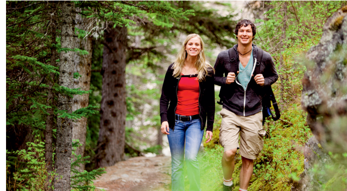
Erleben Sie spielend die Vielfalt der Region