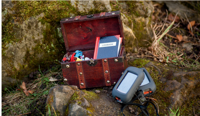
Geschafft: mit Hilfe von GPS-Geräten ist der Schatz gehoben