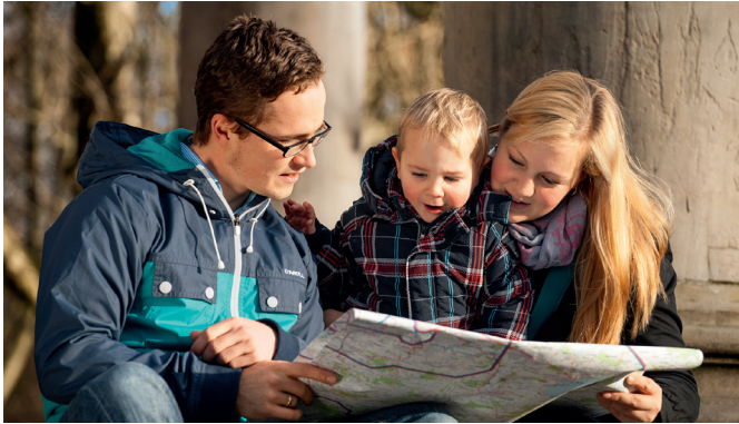
Geocaching: ein großer Spaß – auch für kleine Schatzsucher