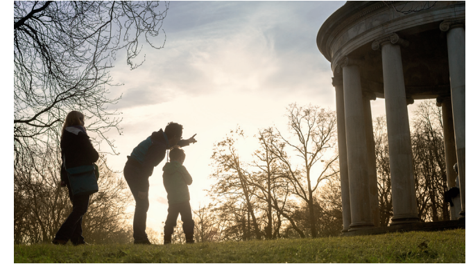
Die Touren führen zu vielen Sehenswürdigkeiten der Region

Spruch: Insgesamt warten 17 „Musikalische Ge(o)heimnisse der Region Hannover“ darauf, von Ihnen entdeckt zu werden!