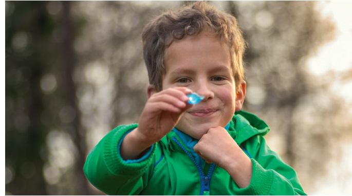
Geschätzte Erinnerungsstücke: die sogenannten travel bugs