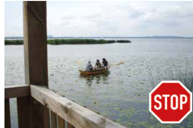
Schwimmblattbestände stehen überall unter Naturschutz. Das Hineinfahren ist verboten!