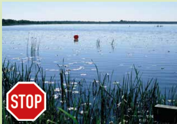
Rote oder weiße Bojen-Ketten kennzeichnen die wasserseitige Grenze des Naturschutzgebietes