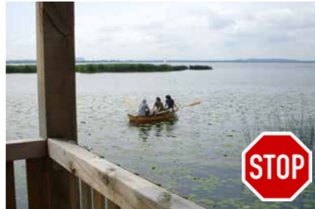
Schwimmblattbestände stehen überall unter Naturschutz. Das Hineinfahren ist verboten!