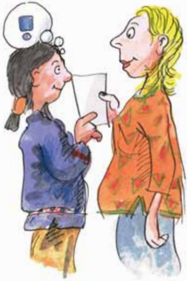
Diyalogda – anlatmak ve soru sormak