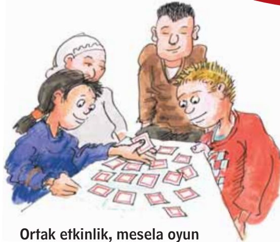
Ortak etkinlik, mesela oyun