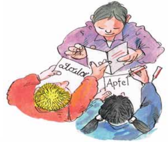
Çokdilliliği teşvik etmek

programı ücretsiz olarak ilkokulların yanı sıra ebeveynlere ve birinci sınıftan dördüncü sınıfa kadar çocuklarına yöneliktir. Okul ve eğitim başarısı yolunda çocuklar ebeveynleri tarafından desteklenmeli ve onlara eşlik edilmelidir (ev ödevleri, okumak, ortak faaliyetler vs.). Eyalet başkenti Hannover bu nedenle, bu nedenle tüm ebeveynlerin ve çocukların birçok ilkokulla yakın işbirliği içinde dil becerilerini, çokdilliliği ve kültürlerarasılığı teşvik etmesine olanak sağlar.