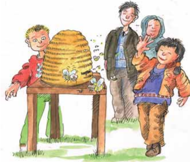
Okul dışı öğrenim yerlerine geziler, örneğin okul biyoloji merkezi