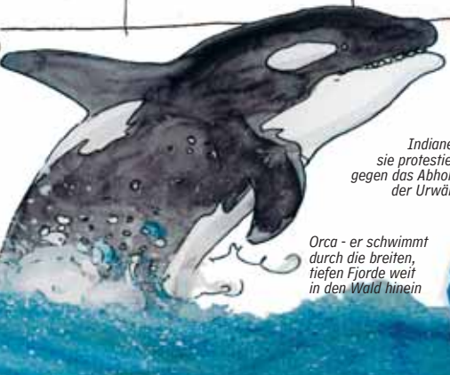
Orca - er schwimmt durch die breiten, tiefen Fjorde weit in den Wald hinein