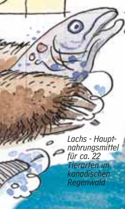
Lachs - Hauptnahrungsmittel für ca. 22 Tierarten im kanadischen Regenwald