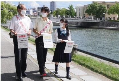
Unterschriftensammlung auf der Straße durch den Präsidenten und Oberschüler*innen (August 2022 in Hiroshima)