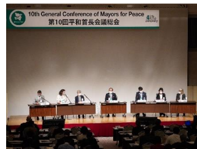
10. Generalversammlung (Oktober 2022 in Hiroshima)

Die Städte im Vorstand treffen sich in der Regel alle zwei Jahre einmal zu einer Vorstandskonferenz in einer der Mitgliedsstädte. Hier werden die Richtlinien der demnächst anstehenden Themen sowie die nächste Generalversammlung besprochen und vorbereitet.