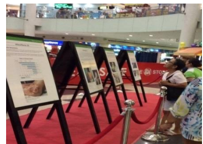
Veranstaltung einer Posterausstellung der Bürgermeister für den Frieden zum Thema „Atombomben“ in einer Mitgliedsstadt (Juni 2015 in Muntinlupa, Philippinen)