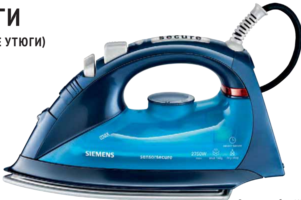
Домашние приборы BSH

Ключевые слова: безопасность, комфорт, деменция, плохое зрение