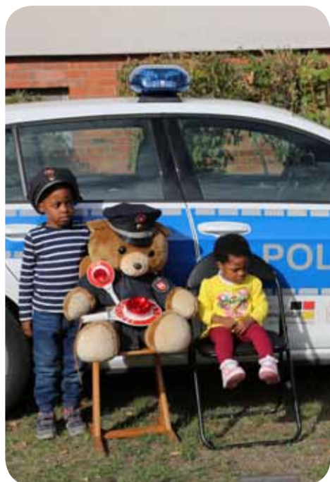
Die Polizei begeisterte Kinder.