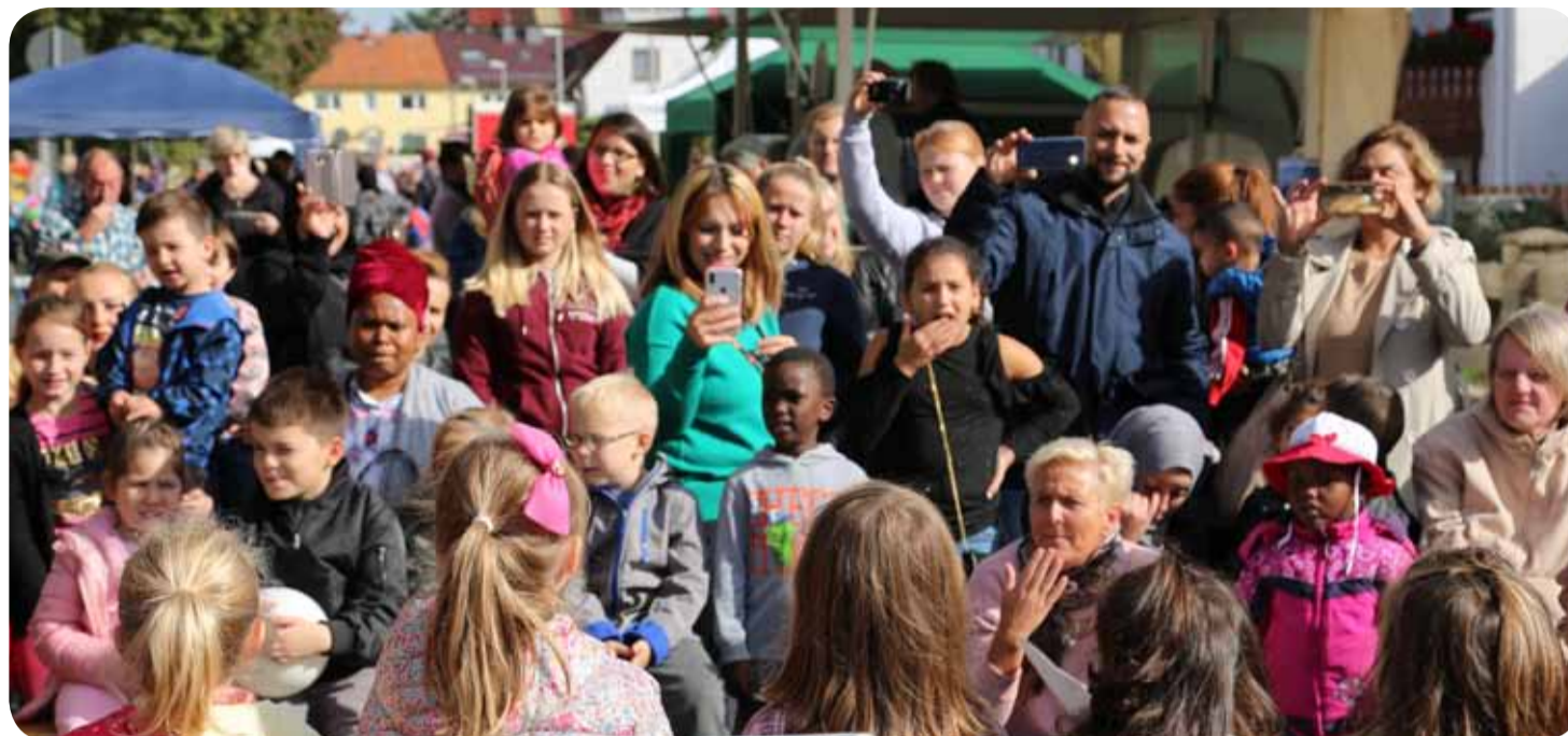
Als die Kinder ihre Lieder sangen, hielten viele BesucherInnen des Festes diesen besonderen Moment fest.

Den nördlichen Teil des Sahlkamps zu beleben, das Miteinander zu fördern, die Nachbarschaft aller zu bestätigen, das hatte sich der Stadtteiltreff nun zur Aufgabe gemacht. Ende September war es soweit: Viele BewohnerInnen genossen