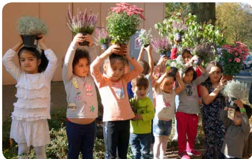
Kinder der Gärtnergruppe Steigerwaldweg bepflanzen eines der größten Beete im Einkaufszentrum Hägewiesen

+++ +++ +++ +++ +++ +++ +++ +++ +++ +++ +++ +++ +++ +++ +++ +++ +++ +++ +++ +++ +++ +++ +++ +++ +++ +++ +++ +++ +++ +++ +++ +++ +++ +++ +++ +++ +++ +++ +++