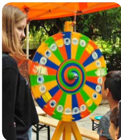
Das Glücksrad war die große Attraktion

Überraschend erschien auch ein prominenter Gast: Ministerpräsident Stephan Weil, Schirm-