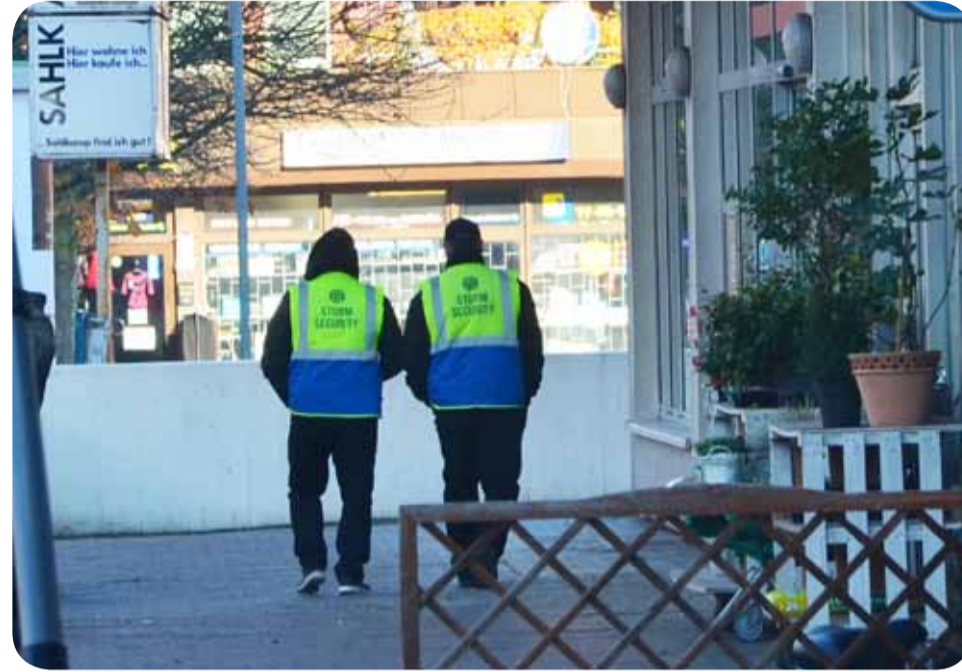
Seit August patrouilliert der Sicherheitsdienst an den Hochhäusern in Sahlkamp-Mitte.

Deutsche Wohnen: Das ist Voraussetzung für weitere Investitionen im Sahlkamp