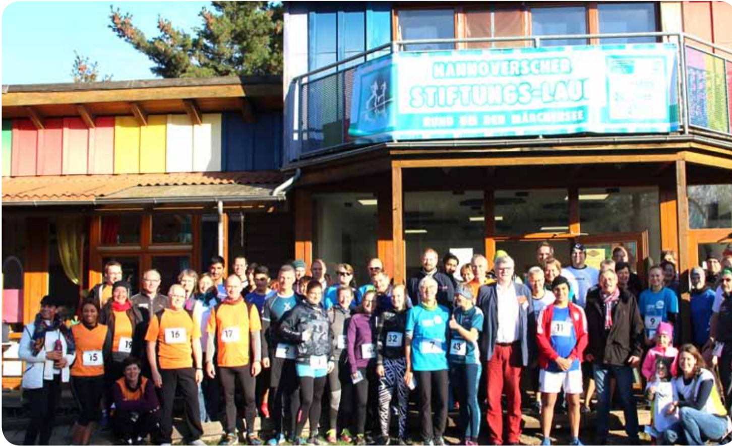
Bei bestem Wetter versammelten sich alle TeilnehmerInnen zum Start am Stadtteilbauernhof.