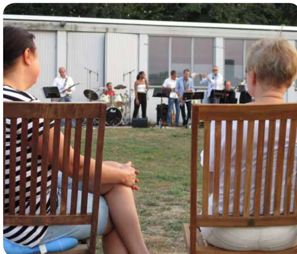
Die Band Soulgalaxy brachte die TeilnehmerInnen vom Blind Date Kultur im Aero-Club in Fahrt

Wer sich für den Modellflug oder das Segelfliegen interessiert, kann unter www.haec.de/ Kontakt zum Verein Hannoverscher Aero-Club e.V. aufnehmen. Mit der Segelflug-Ausbildung kann man schon mit 13 Jahren beginnen.