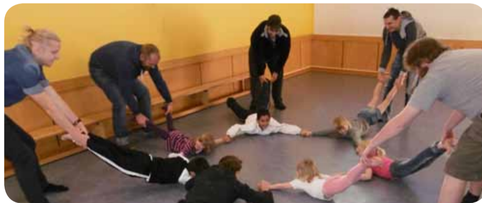
„Rübenziehen“: Eltern und Kinder bewegen sich gemeinsam.

Reich ein weiteres Angebot im Familienzentrum, durchgeführt von der Kinderturnstiftung und der Krankenkasse KKH. Vorbild der pädagogischen Arbeit sind die Grundlagen des „Early Excellence Ansatzes“, die davon ausgehen, dass jedes Kind einzigartig ist und über ganz besondere Stärken