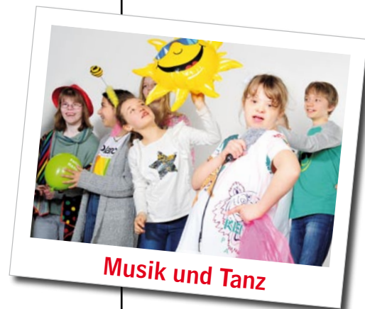
Musik und Tanz