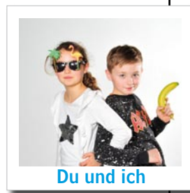
Du und ich