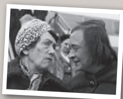
Mary Wigman mit Yvonne Georgi, Ballettchefin am Opernhaus und Professorin an der Musikhochschule Hannover