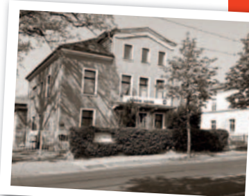
In diesem Gebäude an der Bautzener Landstraße 107 (früher Schillerstraße 17) in Dresden befand sich die Wigman-Schule. Der Übungsraum wurde 1920 in expressionistischer Manier „knallrot“ gestrichen.

Auch ihre Gruppentänze entwickelt sie aus der Wechselbeziehung zwischen Choreografin und Tänzer*innen, sie entstehen durch das bewusste Einbringen der verschiedenen Persönlichkeiten in den Tanz.