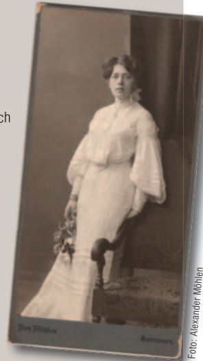
Mary Wigman um 1905

1973 Mary Wigman stirbt am 13. September in Berlin. Sie wird im Familiengrab in Essen beigesetzt.