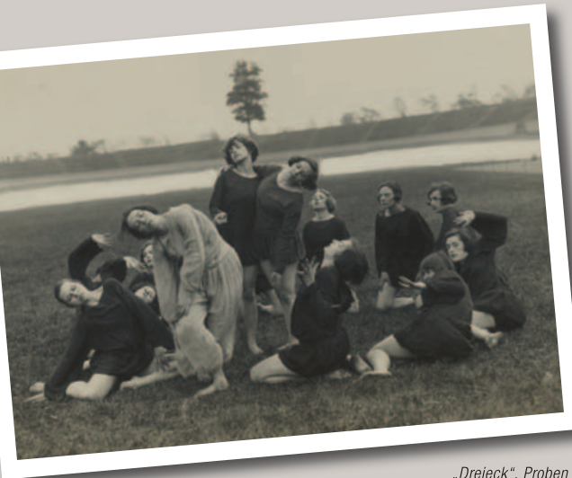
„Dreieck“, Proben zu Szenen aus einem Tanzdrama, Berlin 1923

tanz in Deutschland. In der Choreografie Tanzmärchen , die auch am Städtischen Opernhaus Hannover gezeigt wird, entwickelt sie eine durchgehende Handlung. Getanzt wird in aufwändigen, fantasievollen Kostümen.