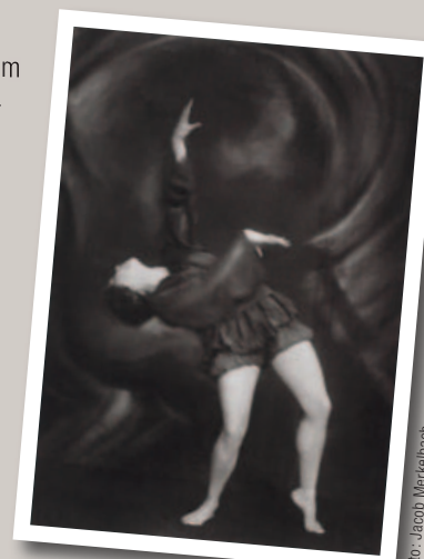
Mary Wigman, 1922

Der Gruppentanz wird zu einem wichtigen Bestandteil der choreografischen Arbeit Mary Wigmans. Besonders das abendfüllende Szenen aus einem Tanzdrama kann als ein Meilenstein angesehen werden, es begründet den künstlerischen Gruppen-