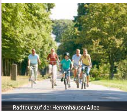
Radtour auf der Herrenhäuser Allee