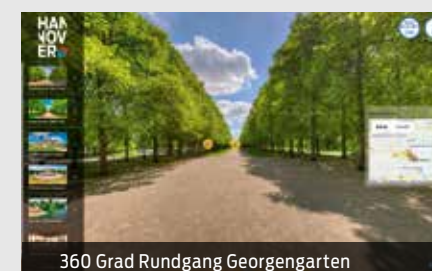
360 Grad Rundgang Georgengarten