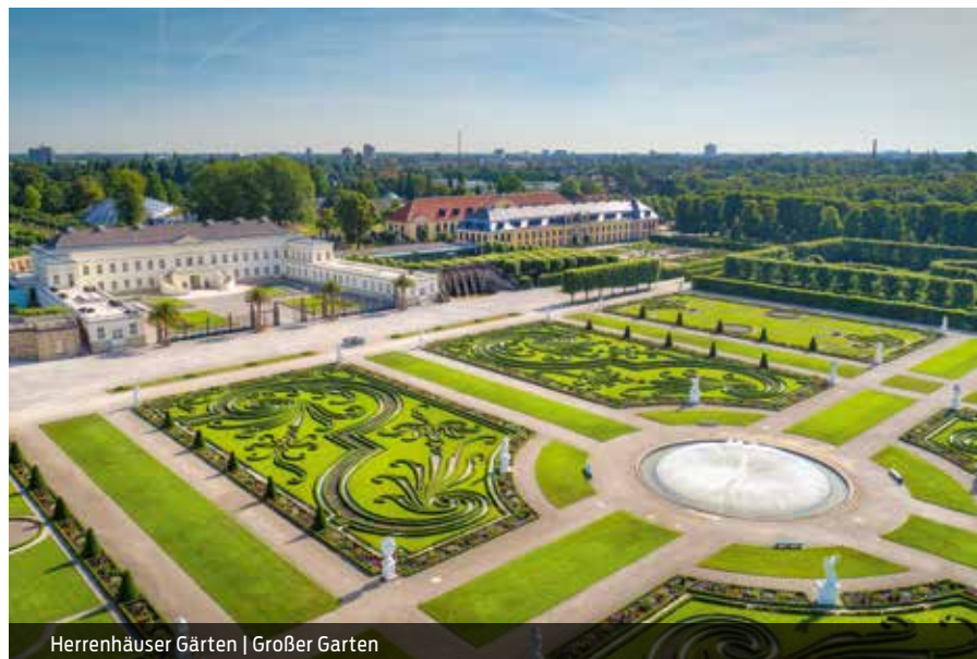
Herrenhäuser Gärten | Großer Garten

Hier atmen Ihre Gäste anschließend den Hauch der Stadtgeschichte: Die historischen Fachwerkkulissen der Altstadt zählen zu den besonderen Sehenswürdigkeiten der City. Man schlendert durch malerische Gassen, entdeckt exklusive Boutiquen, einladende Cafés und Restaurants. Wenige Meter weiter lässt es sich am lauschigen Leineufer perfekt entspannen.