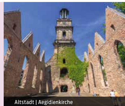
Altstadt | Aegidienkirche