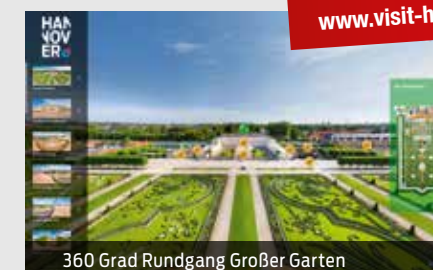
360 Grad Rundgang Großer Garten