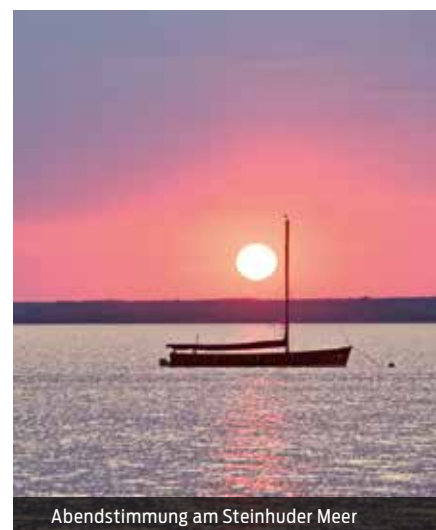
Abendstimmung am Steinhuder Meer

Ihre Gruppe möchte Steinhude so richtig kennenlernen? Bei der Besichtigung einer Aalräucherei lernt sie die Besonderheiten des Steinhuder Rauchaals kennen. Anschließend genießen Ihre Gäste ein leckeres Mittagessen in einem Traditionsrestaurant. Frisch gestärkt geht es dann mit den historischen Segelbooten zur Insel Wilhelmstein. Hier erkundet die Gruppe die Festung unter fachkundiger Leitung. Zum Ausklang eines erlebnisreichen Tages wartet der Besuch eines gemütlichen Cafés.