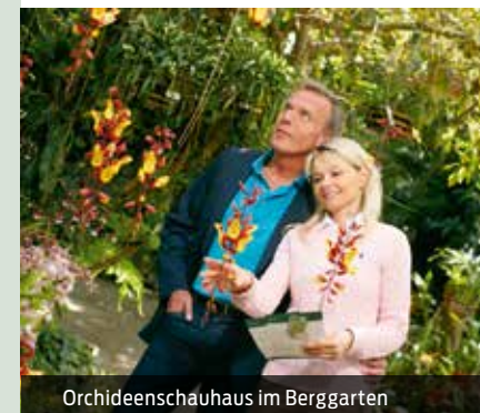
Orchideenschauhaus im Berggarten