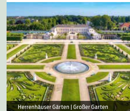
Herrenhäuser Gärten | Großer Garten