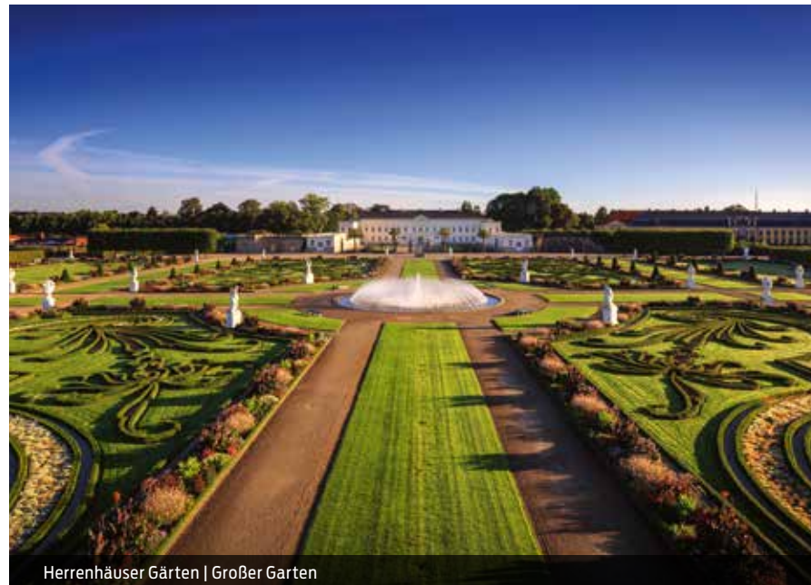
Herrenhäuser Gärten | Großer Garten