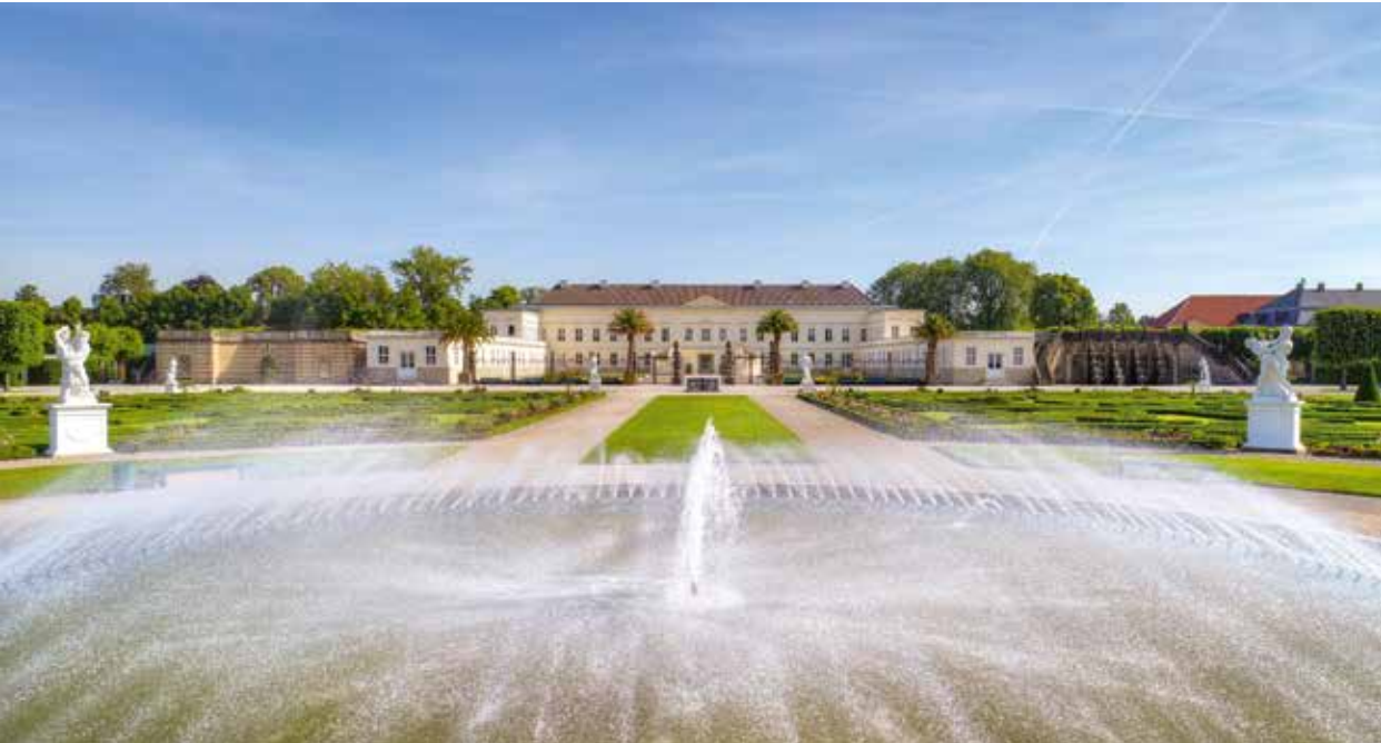
Herrenhäuser Gärten | Großer Garten mit Glockenfontäne und Schloss Herrenhausen

für Ihre Programmgestaltung 2020 haben wir wieder viele gute Gründe für einen Besuch in Hannover und Umgebung! Die Highlights haben wir in dieser Broschüre für Sie zusammengestellt. Unser erfahrenes Team Städtereise unterstützt Sie gern bei der Reiseplanung für Ihre Gruppen. Wir bieten Ihnen neben der Vermittlung von Einzelleistungen (z.B. Stadtführungen) auch komplette Gruppenarrangements an. Alle Informationen finden Sie auch auf unserer Internetseite www.visit-hannover.com/bus .