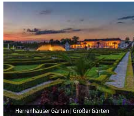
Herrenhäuser Gärten | Großer Garten