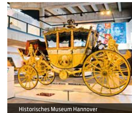
Historisches Museum Hannover

mind. 15 Personen Dauer: ca. 4 ½ Stunden ganzzjährig