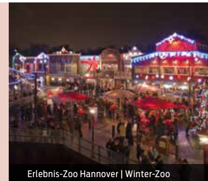
Erlebnis-Zoo Hannover | Winter-Zoo

Auch außerhalb der Altstadt herrscht Weihnachtsstimmung: Vor dem Hauptbahnhof laden rund 40 Stände dazu ein, kulinarische Köstlichkeiten und weihnachtliches Kunsthandwerk zu entdecken. Und auf der Lister Meile geht es familiär zu: Kindereisenbahn, Karussells und Kasperletheater bringen die Kinderaugen zum Leuchten und kulinarische Köstlichkeiten lassen auch hier keine Wünsche offen. Auch im Umland von Hannover laden zahlreiche kleine Märkte mit Kunsthandwerk und Gaumenfreuden zum gemütlichen Weihnachtsbummel ein.