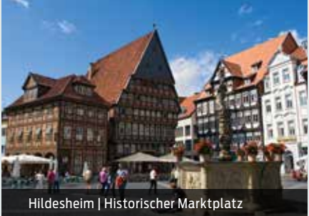
Hildesheim | Historischer Marktplatz