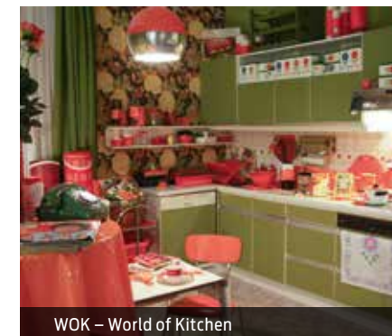
WOK – World of Kitchen

mind. 15 Personen | Dauer: ca. 3 Stunden ganzzjährig