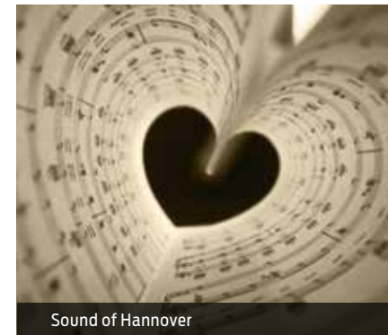
Sound of Hannover

Wir bieten auch Stadtrundfahrten im Doppeldecker-Panoramabus an. Preis auf Anfrage.