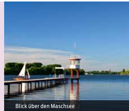
Blick über den Maschsee

bis 10 Pers. € 21,- 11–25 Pers. € 35,- 26–40 Pers. € 54,- 41–75 Pers. € 68,-