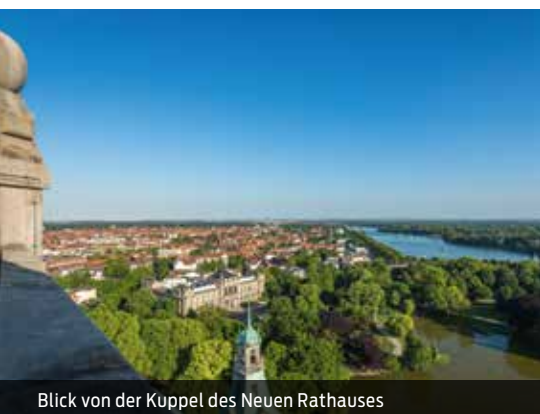
Blick von der Kuppel des Neuen Rathauses