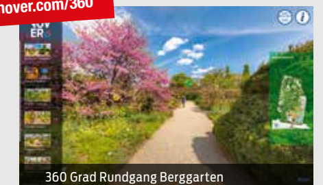
360 Grad Rundgang Berggarten