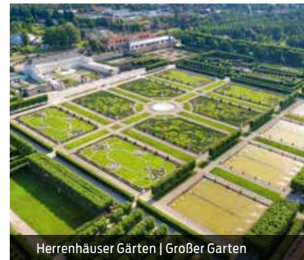
Herrenhäuser Gärten | Großer Garten

Öffnungszeiten: Großer Garten und Berggarten öffnen ganzjährig um 9 Uhr. Die Schließung variiert saisonabhängig. Das Museum öffnet in der Sommersaison täglich von 11 bis 18 Uhr. In der Wintersaison (1. Nov. bis 31. März) ist es von Do bis So in der Zeit von 11 bis 16 Uhr geöffnet.