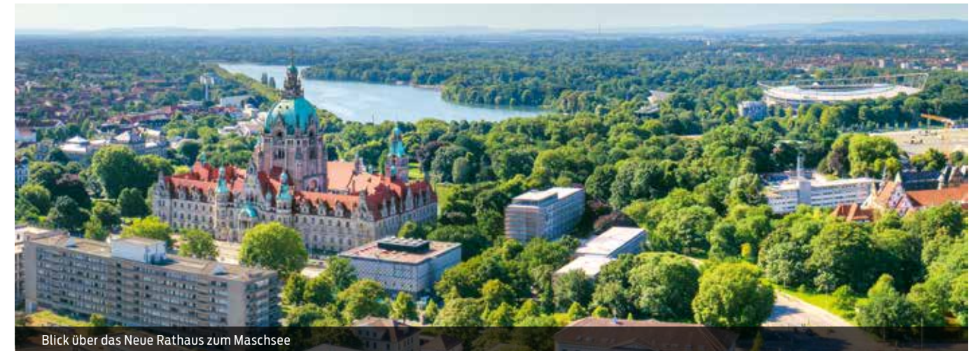
Blick über das Neue Rathaus zum Maschsee