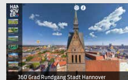
360 Grad Rundgang Stadt Hannover

Unter www.visit-hannover.com/360 zeigen Ihnen interaktive 360°-Rundgänge die schönsten Ecken der Stadt. Erleben Sie die Atmosphäre der Herrenhäuser Gärten, der Altstadt oder des Erlebnis-Zoos hautnah oder unternehmen Sie einen virtuellen Ausflug in die Region Hannover!