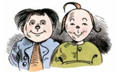
Max und Moritz

max. 20 Personen je Gästeführer Dauer: ca. 1 Stunde Optional: Führung mit Audioguide (2 € pro Person)