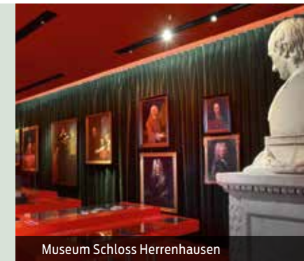
Museum Schloss Herrenhausen

max. 25 Personen je Gästeführer Dauer: 1½ Std.