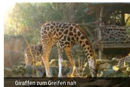
Giraffen zum Greifen nah