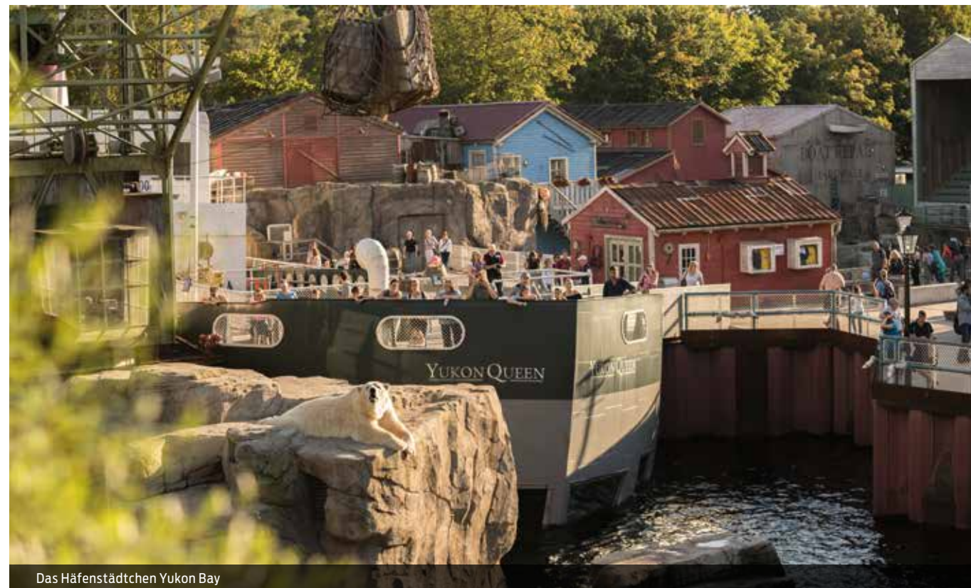
Das Häfenstädtchen Yukon Bay