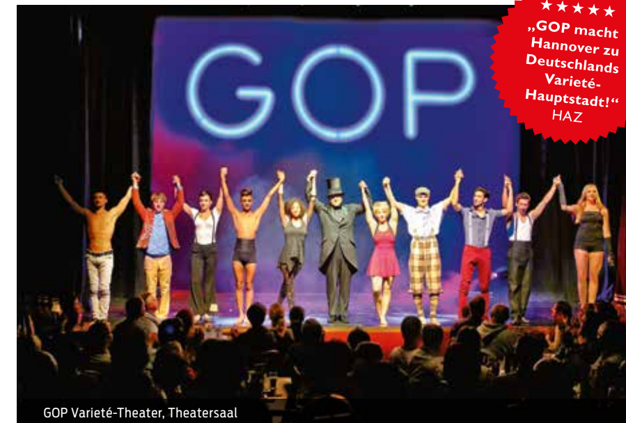
GOP Variété-Theater, Theatersaal

Anschrift: Hannah-Arendt-Platz 1, 30159 Hannover Ansprechpartner: Frau Bartel Tel.: 0511 30302048 E-Mail: oeffentlichkeitsarbeit@it.niedersachsen.de