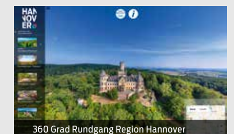
360 Grad Rundgang Region Hannover