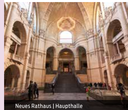
Neues Rathaus | Haupthalle