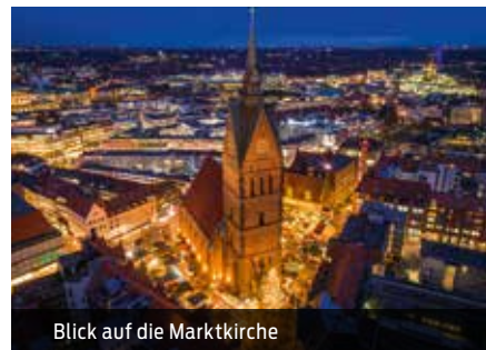
Blick auf die Marktkirche