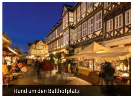
Rund um den Ballhofplatz