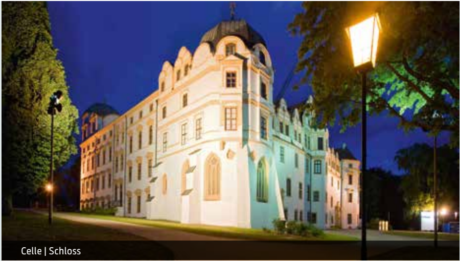
Celle | Schloss