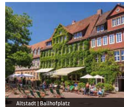
Altstadt | Ballhofplatz

mind. 20 Personen Dauer: ca. 3 Stunden April – Oktober