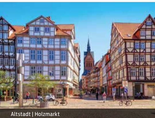
Altstadt | Holzmarkt

Lassen Sie Ihre Gäste zunächst das Highlight Hannovers entdecken, die Herrenhäuser Gärten. Barocke Pracht und Wasserspiele im Großen Garten, romantische Landschaftsbilder im Georgengarten, botanische Schätze im Berggarten: Die einstige Sommerresidenz der Welfen vermittelt noch heute ein fürstliches Lebensgefühl, unabhängig von der Jahreszeit. In Kombination mit einem Besuch des Museums Schloss Herrenhausen, des SEA LIFE Aquariums, des Museums Wilhelm Busch – Deutsches Museum für Karikatur und Zeichenkunst, einer spannenden Führung und der Einkehr in einem der Restaurants werden Ihre Gäste hier eine genussvolle Zeit verbringen!