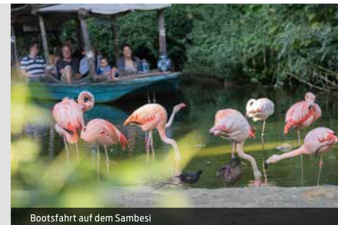
Bootsfahrt auf dem Sambesi

Den Erlebnis-Zoo Hannover und die Stadt im 360°-Grad-Rundgang entdecken: www.visit-hannover.com/360