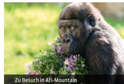
Zu Besuch in Afi-Mountain