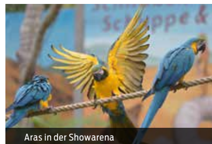
Aras in der Showarena