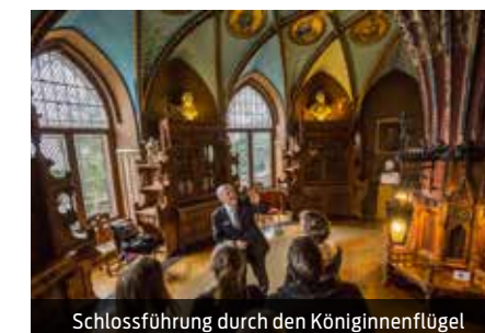
Schlossführung durch den Königinnenflügel

Schloss Marienburg 30982 Pattensen Tel: +49 5069 34 8000 Fax: +49 5069 34 8009 office@schloss-marienburg.de