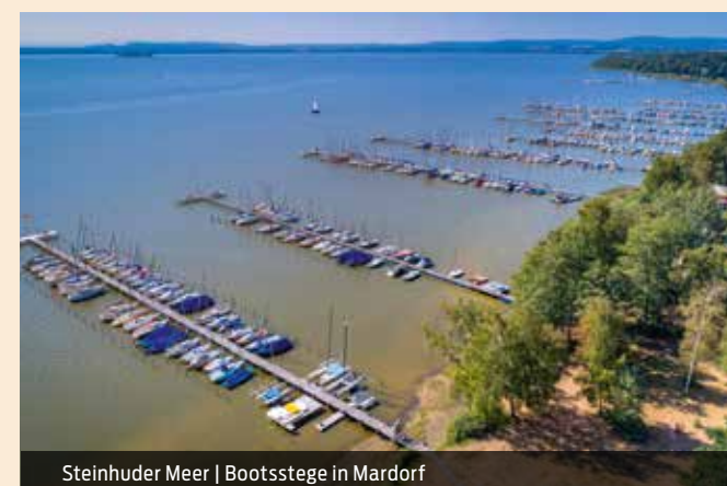
Steinhuder Meer | Bootsstege in Mardorf

Wie wäre es anschließend mit einem Besuch des Naturpark-Informationszentrums, der Schmetterlingsfarm oder des Fischer- und Webermuseums mit dem Spielzeugmuseum im einstigen Fischerdorf Steinhude?