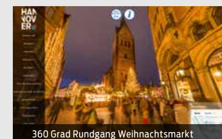
360 Grad Rundgang Weihnachtsmarkt