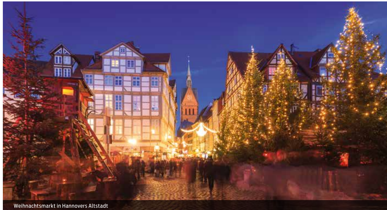
Weihnachtsmarkt in Hannovers Altstadt