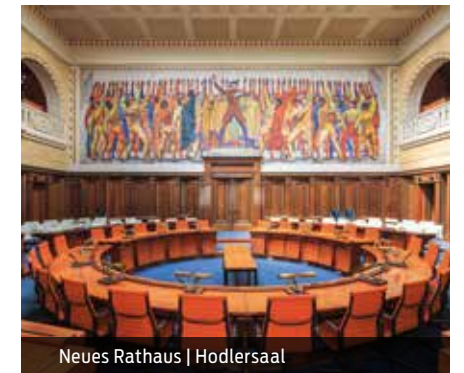
Neues Rathaus | Hodlersaal

inkl. 5 Kostproben an verschiedenen Stationen | mind. 10 Personen | Dauer: 3 Stunden