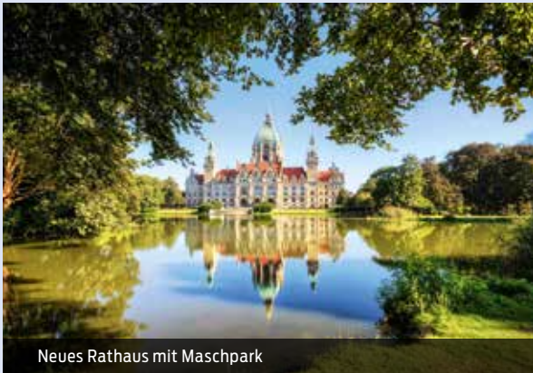
Neues Rathaus mit Maschpark

für Ihre Programmgestaltung 2020 haben wir wieder viele gute Gründe für einen Besuch in Hannover und Umgebung! Die Highlights haben wir in dieser Broschüre für Sie zusammengestellt. Unser erfahrenes Team Städtereise unterstützt Sie gern bei der Reiseplanung für Ihre Gruppen. Wir bieten Ihnen neben der Vermittlung von Einzelleistungen (z.B. Stadtführungen) auch komplette Gruppenarrangements an. Alle Informationen finden Sie auch auf unserer Internetseite www.visit-hannover.com/bus .