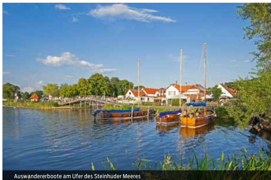
Auswandererboote am Ufer des Steinhuder Meeres