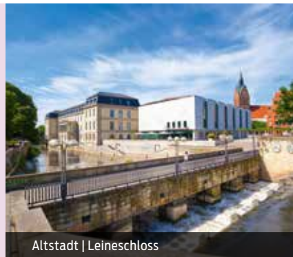
Altstadt | Leineschloss

E-Mail: staedtereise@hannover-tourismus.de