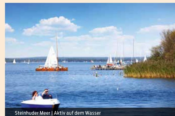
Steinhuder Meer | Aktiv auf dem Wasser