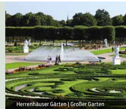
Herrenhäuser Gärten | Großer Garten

mind. 15 Personen Dauer: ca. 3 ½ Stunden | ganzjährig