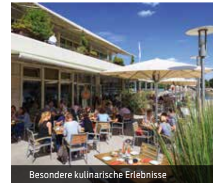
Besondere kulinarische Erlebnisse