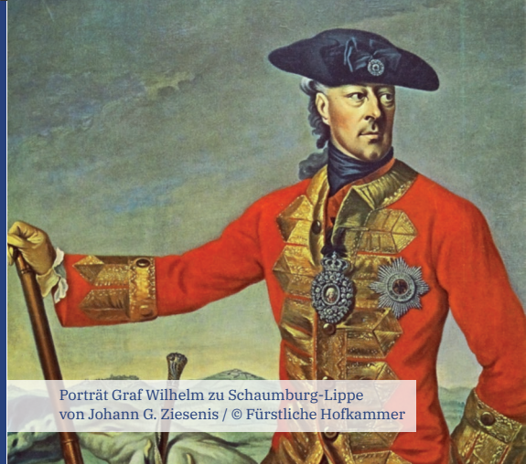
Porträt Graf Wilhelm zu Schaumburg-Lippe von Johann G. Ziesenis

Als Militärschule, Wissenschafts- und Forschungszentrum, auch als Sternwarte wurde der Wilhelmstein genutzt. Er zog viele berühmte Besucher an – und war sogar Vorbild für die portugiesische Festung Fort de Lippe bei Elvas. Das erste Unterwasserboot der Welt, der „Steinhuder Hecht“, wurde hier als Prototyp entwickelt. Bis 1876 war die Insel Staatsgefängnis Schaumburg-Lippes und die erste deutsche Gefängnisinsel.