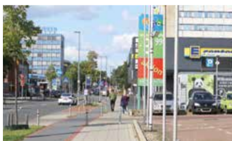
Die Zugänge ins Quartier könnten verbessert werden. Das gilt für den nördlichen Abschnitt der Göttinger Chaussee ebenso wie für die Fahrrad- und Fußverbindung, die unter dem Ricklinger Kreislauf hindurchführt.

Übersetzungen dieses Artikels ins Arabische und Türkische stehen auf Seite 2.