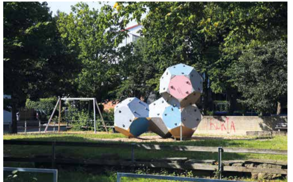
Die Würfel sind sozusagen gefallen: Die Freiflächen und Spielplätze an der Dormannstraße sollen erneuert werden. Dafür ist kommendes Jahr ein Beteiligungsverfahren mit Bewohner*innen vorgesehen.

2022 startet zudem ein Projekt in der Dormannstraße. Die öffentliche Freifläche inklusive Spielplätzen zwischen den Häuserzeilen soll erneuert