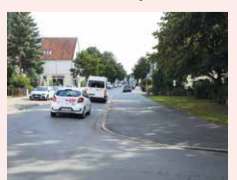
Der Übergang zum Spielplatz am Nenndorfer Platz ist an der Pyrmonter Straße nicht ungefährlich. Hier soll deshalb baulich etwas geschehen.