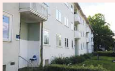
In die Jahre gekommen: Die Häuser im Rohrskamp 1-4 sollen modernisiert werden.

Mit den Arbeiten wird das Tochterunternehmen der Landeshauptstadt Hannover in den kommenden Monaten beginnen.