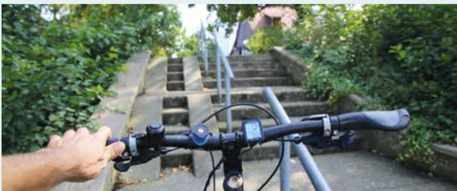
Hindernis: Wer vom Fahrradweg entlang der B65 zur Straße Auf dem Rohe gelangen will, muss mehrere Stufen überwinden.