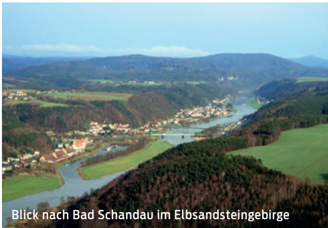
Blick nach Bad Schandau im Elbsandsteingebirge