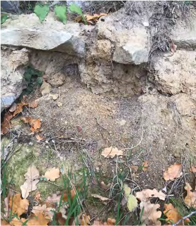
■ Natürliche Abbruchkanten, Erdhügel und Lehmwände: Sie dienen als Insektennistplatz und werden von Vögeln und Insekten zur Gewinnung von Baumaterial aufgesucht.