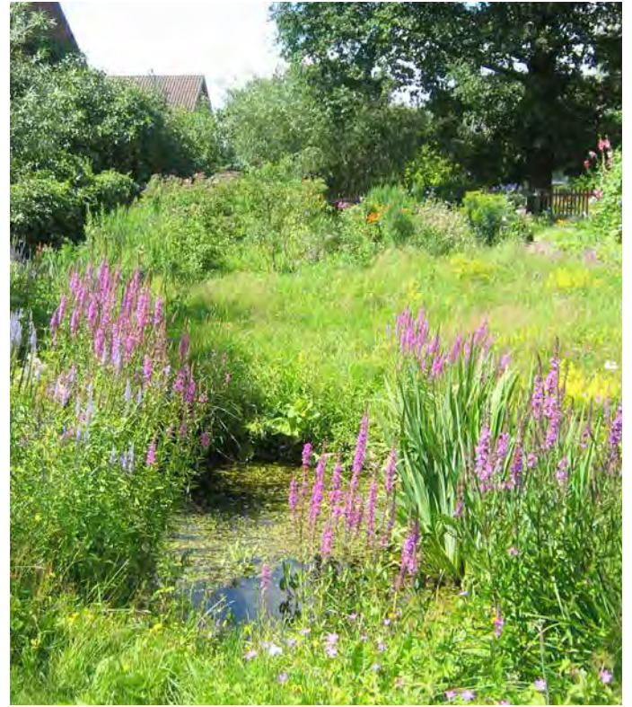
■ Wasser zum Trinken und Baden: Vogeltränken, Untersetzer mit nassem Moos, Sumpfbeete oder Tümpel sind lebenswichtig. Hineingefallene Insekten und Igel brauchen Ausstiegshilfen.