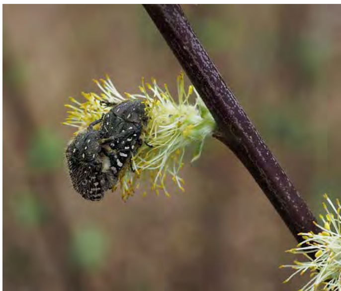
Weidenarten ( Salicaceae )

Die Blüten locken Bestäuberinsekten aller Artengruppen an, die Beeren werden im Winter z. B. von Amseln, Rot- und Wacholderdrosseln und Seidenschwänzen gefressen, die Knospen von Gimpeln.