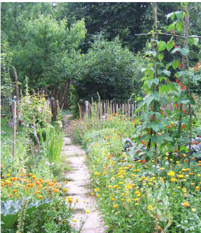
■ Gemüse- und Küchenkräuterbeet: Blühende Gemüsepflanzen und Küchenkräuter sind eine wertvolle Nahrungsquelle für Mensch und Tier.