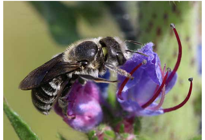
Natternkopf ( Echium vulgare )

Efeu bildet Blüten in seiner Altersform, ab einem Alter von etwa 10 Jahren. Er blüht dann im September und ist für die dann noch fliegenden Insekten, z. B. die Efeu-Seidenbiene, lebenswichtig. Die Beeren reifen gegen Ende des Winters. Darauf sind Amseln, Stare, Mönchsgrasmücken u.a. Vogelarten angewiesen.