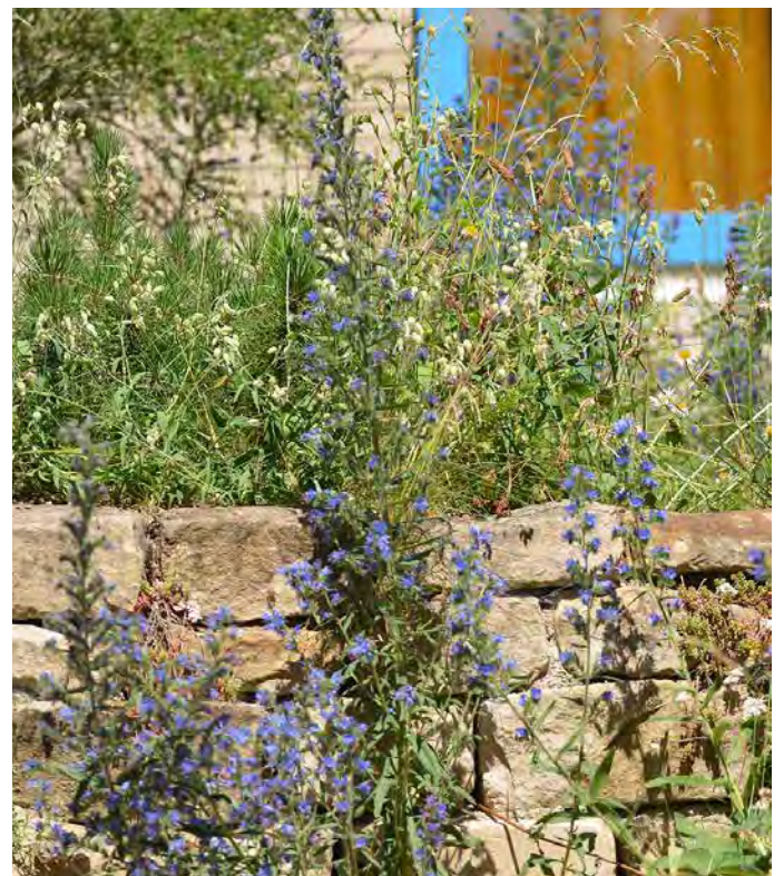
■ Trockenmauern, Natursteinhaufen und Schotterrasen sind eine Alternative zu Beton. Sitzplätze, Wege und Auffahrten können begrünt werden. In breiten Fugen siedeln Insekten.