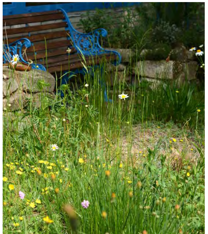
■ Unversiegelte Sitzplätze laden zum Entspannen und Beobachten ein. Es bieten sich gemähte Wiesenbereiche oder blumenreiche „Schotterrasen“ an.