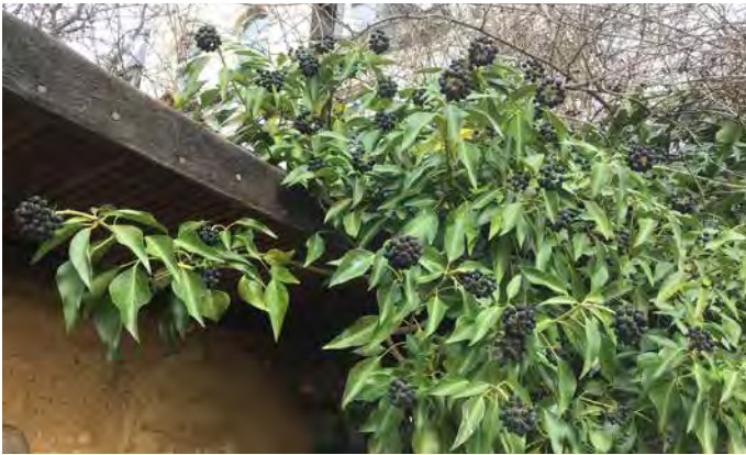
Efeu ( Hedera helix )

Diese zweijährige Pflanze sieht einer Distel ähnlich. Ihre Blüten sind Insektenmagnete, die Samen werden von Stieglitzen geliebt. Sehr dekorativ auch im Winter.