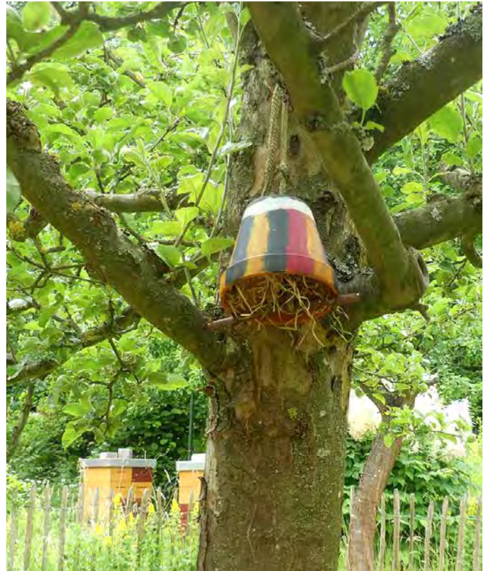
Holzwohle-Glocke für Ohrenkneifer

Wenn gegossen werden muss, dann ergiebig und nur einmal wöchentlich.