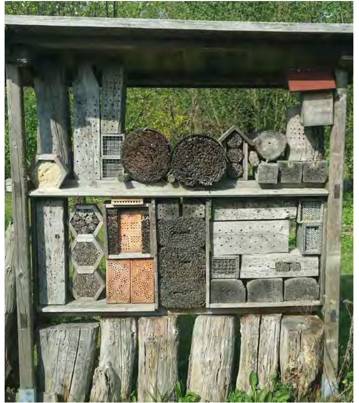
■ Nisthilfeelemente und Nistkästen für Insekten und Vögel müssen fachgerecht gebaut sein und entsprechend der Bedürfnisse der einzelnen Arten angebracht werden.