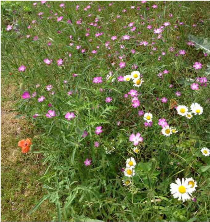
Kornrade, Klatschmohn und Wiesenmargerite