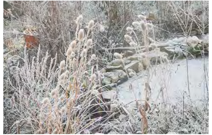
Wilde Karde ( Dipsacus fullonum )

Rankpflanze des Waldrandes, deren Blüten von langrüsseligen Schmetterlingen, insbesondere Nachtfaltern, angefliegen werden, z. B. von Taubenschwänzchen und anderen Schwärmern.