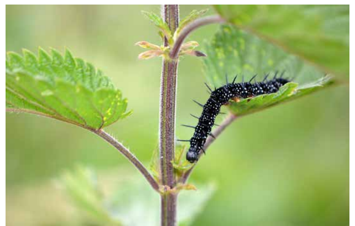
Brennnessel ( Urtica dioica )

Heimische Rosen sind nicht nur eine sehr gute Nektar- und Pollenquelle, sondern auch eine Augenweide. Nicht nur der Rosenkäfer, sondern auch viele andere Arten nutzen die Blüten und auch die Hagebutten.