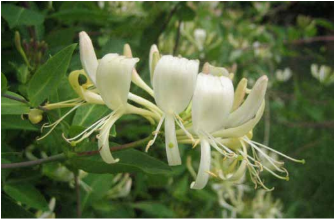
Geißblatt ( Lonicera periclymenum )

Rankpflanze des Waldrandes, deren Blüten von langrüsseligen Schmetterlingen, insbesondere Nachtfaltern, angefliegen werden, z. B. von Taubenschwänzchen und anderen Schwärmern.