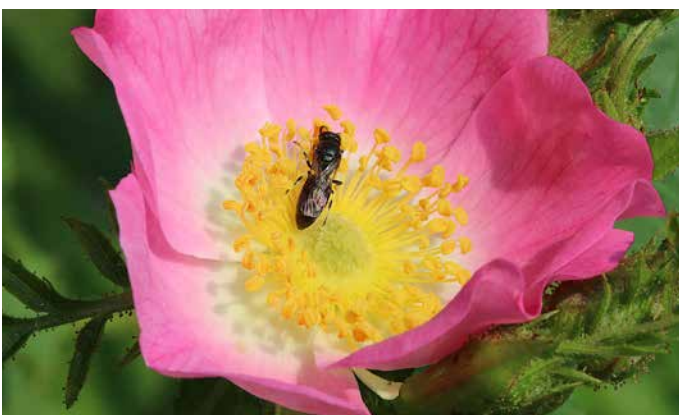
Ungefüllte Rosen, Wildrosen (Rosaceae)

Eine leuchtend blau blühende zweijährige Art, Lebensgrundlage für spezialisierte Bienenarten.