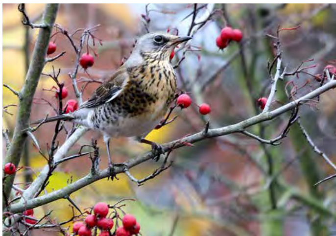
Weißdorn ( Crataegus )

Von Blättern, Blüten und Beeren ernähren sich über 160 Insekten- und Vogelarten!