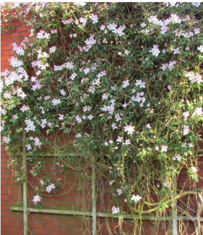
■ Rankende Pflanzen begrünen Fassaden, Sichtschutzelemente, Mauern, Zäune und abgestorbene Bäume oder Pfosten. Auch Flachdächer von Häusern, Garagen oder Schuppen können gut bepflanzt werden.