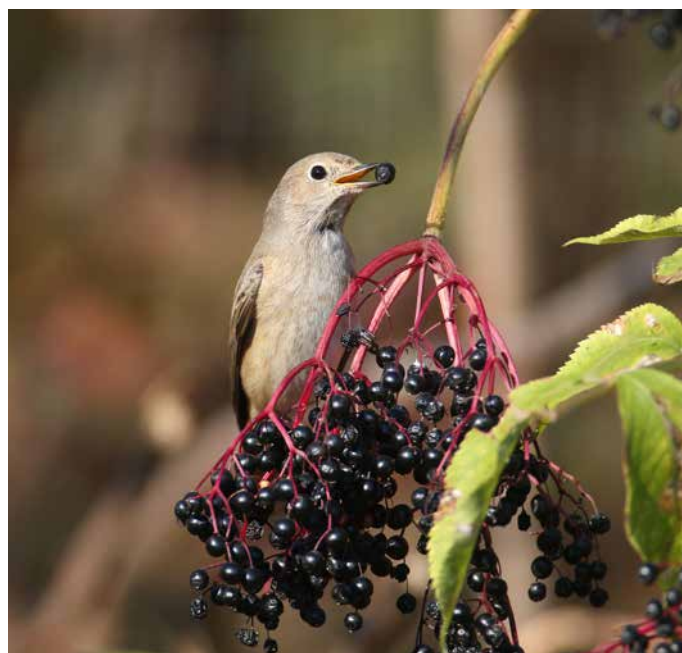
Schwarzer Holunder ( Sambucus nigra )

Nach dem Winter sind die Kätzchen von früh blühenden Weidenarten wie Grau- oder Sal-Weide lebensnotwendige Nektar- und Pollenquelle für zahlreiche Bienenarten. Weiden sind zweihäusig, das heißt, es gibt männliche und weibliche Pflanzen. Die weiblichen Kätzchen sind unscheinbar grünlich, während die männlichen Blüten durch leuchtend gelbe Staubbeutel auffallen. Sowohl die männlichen als auch die weiblichen Kätzchen produzieren Nektar. Doch nur die männlichen Pflanzen liefern zudem ein überaus reiches Pollenangebot und sind daher aus Insektensicht zu bevorzugen. Die Weidenblätter sind außerdem Nahrung für viele Insektenarten.