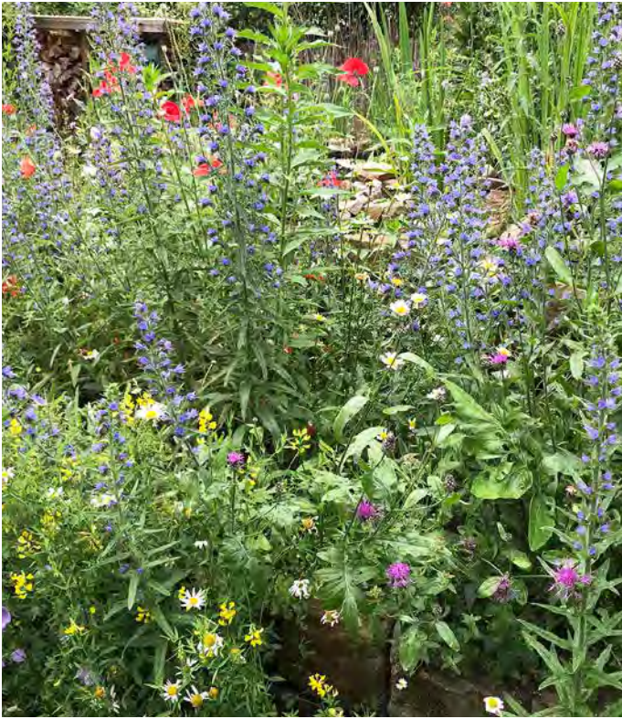
■ Beete und Staudensäume mit heimischen Kräutern finden sich vor Hecken, Zäunen und Mauern. Ihre Stängel bleiben als Nist- und Überwinterungsquartier bis zum nächsten Frühjahr stehen.