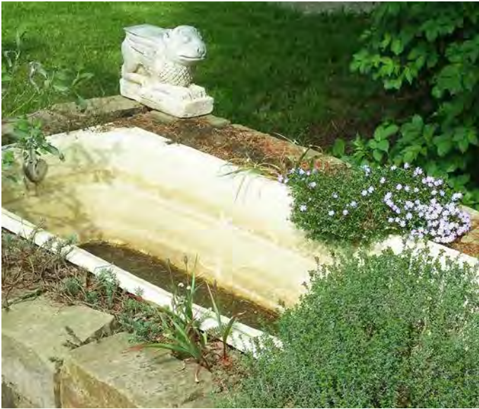
Zweites Leben für die Badewanne