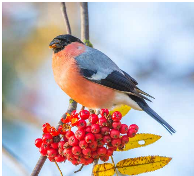
Eberesche ( Sorbus aucuparia )

Von Blättern, Blüten und Beeren ernähren sich über 160 Insekten- und Vogelarten!