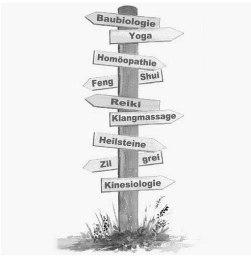
21.01. Wellnesstag